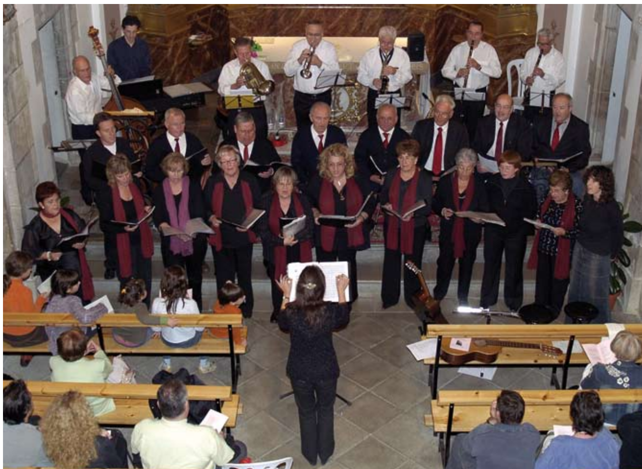
Text: LES NOSTRES VEUS