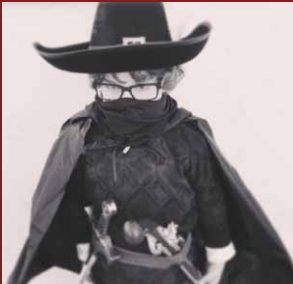
Fotografia guanyadora del concurs, escollida per l'Associació de Fotògrafs de Vilobí. Autor: Jordi Gispert i Taberner