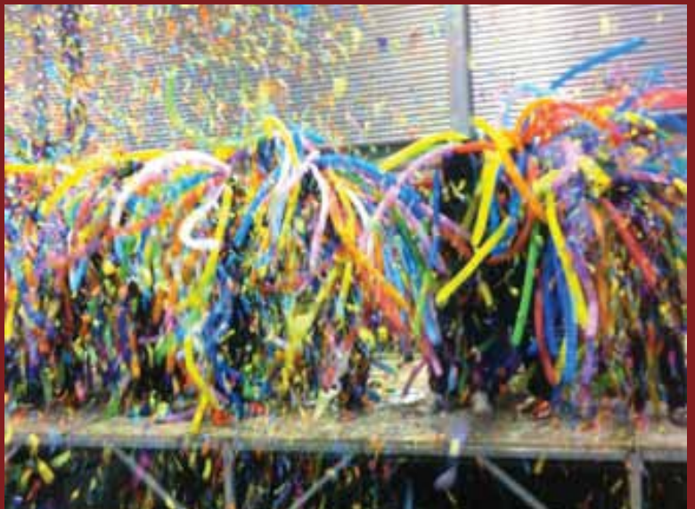
Fotografia més votada al web www.llobatons.cat Autor: Santi Coll