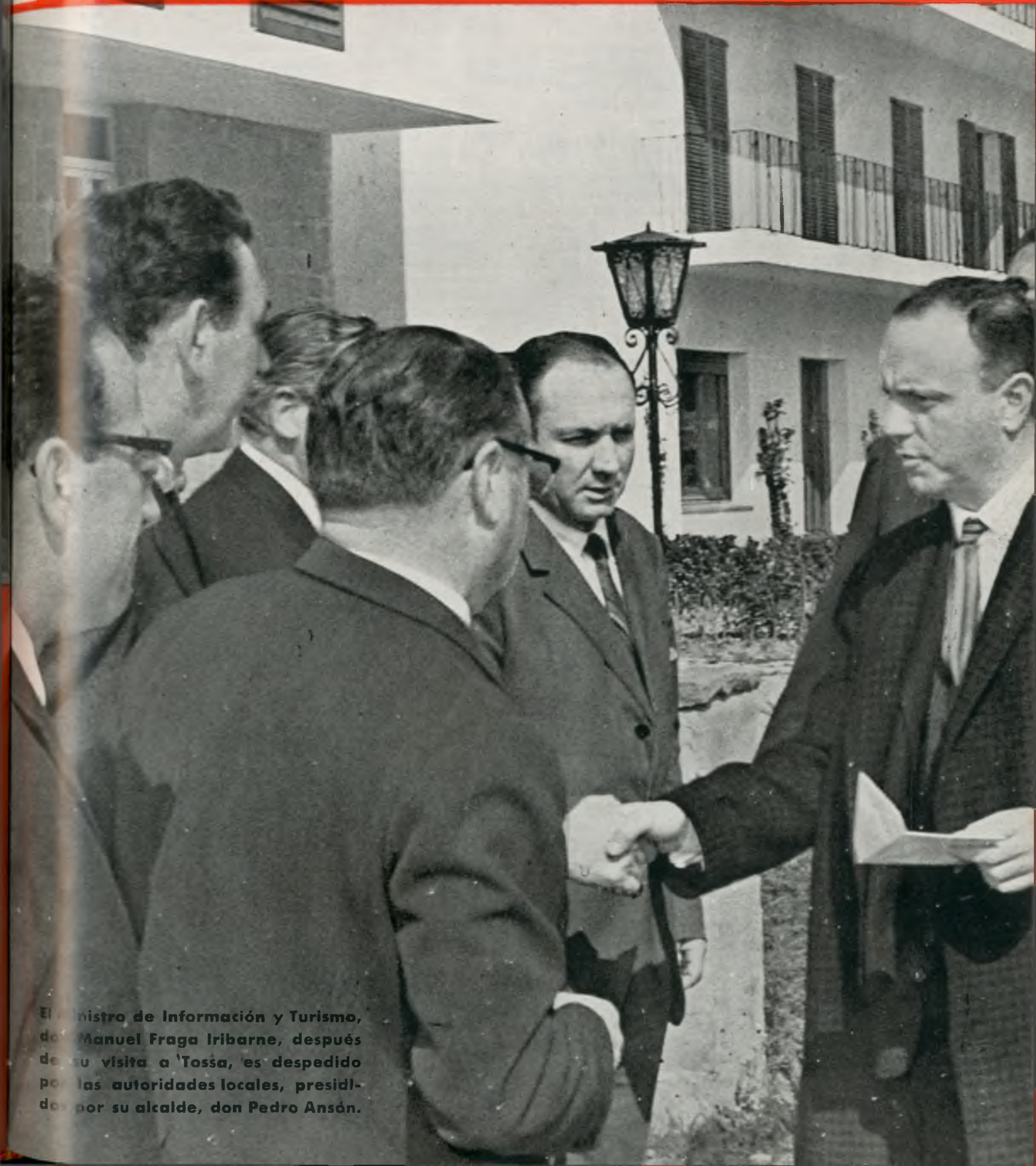
El ministro de Información y Turismo, don Manuel Fraga Iribarne, después de su visita a 'Tossa', es despedido por las autoridades locales, presidido por su alcalde, don Pedro Ansán.