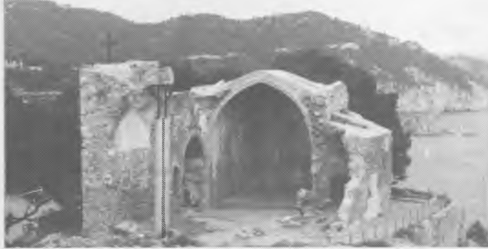
Vista general de l'Església vella des de la Torre de la Pólvora.

L'interior encara es pot comprovar que estava emblanquit amb calç. Pel que fa a l'acabat exterior, el mur fet amb pedra del país, només presenta carejades les pedres que marquen cantonada o canvi de direcció; la resta podia haver estat arrebossada amb morter de calç. La sagristia i les naus laterals que rebien directament els aires de mar tenien aplacats fets amb pedra numulítica carejada.