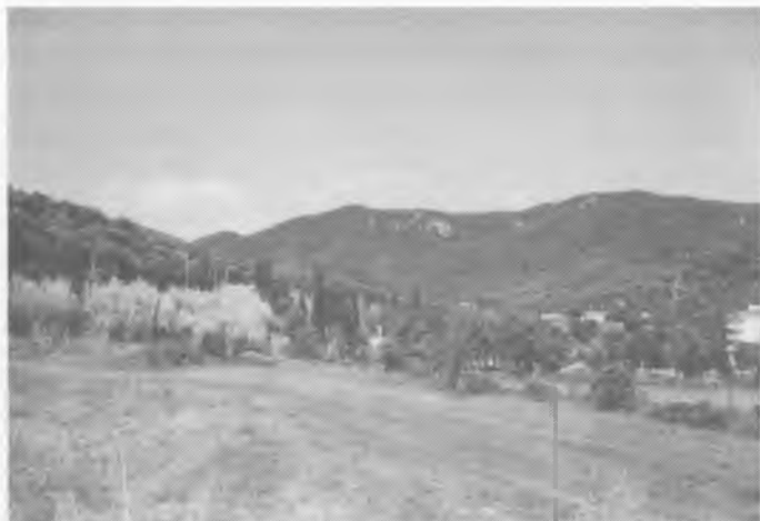
Que en són de maques aquestes muntanyes tan verdes!

-A tu, Colomer, per què t'agrada fer de bomber?