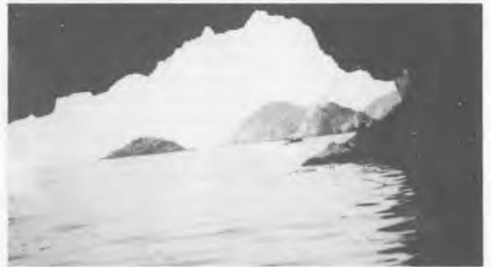
L'illa, Es Pujol d'Arenys i el Cap de Tossa vistos des de l'interior de la Cova Aixafada. (Fotografia de N. Fonalledas - Any 1934)

L'home resistia el bany llarg com a bon submarinista. Semblava insensible a la desfibració i a l'ablaniment. En la distància es veia el seu cap flotant en la blavor de les aigües. Deixà transcòrrer una llarga estona fent el mort.