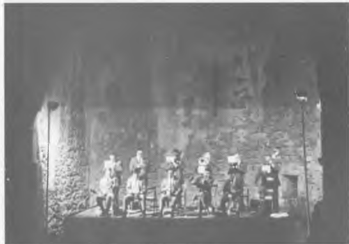
Vila Vella resulta un marc incomparable per a tota mena d'actes musicals com el concert de la Ciutat de Girona.