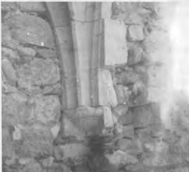
Cul de llàntia de la capella lateral dreta. Està força ben conservat.

La construcció de la sagristia és sens dubte posterior. I això ens ho demostren dos fets: el primer d'ells seria la manca de continuïtat entre l'obra de l'absis i la de la sagristia, fins i tot hi ha marcada una esquerra; un segon fet seria la continuació de la paret de la nau lateral més amunt de la coberta, marcant un límit.