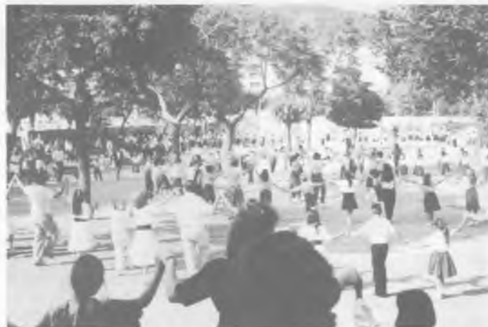
La gran quantitat de sardanistes creà algun petit problema a l'hora de ballar la sardana de germanor de la Trobada Infantil.

Cal destacar la col.laboració rebuda tant per part de les institucions com de cases comercials i particulars.