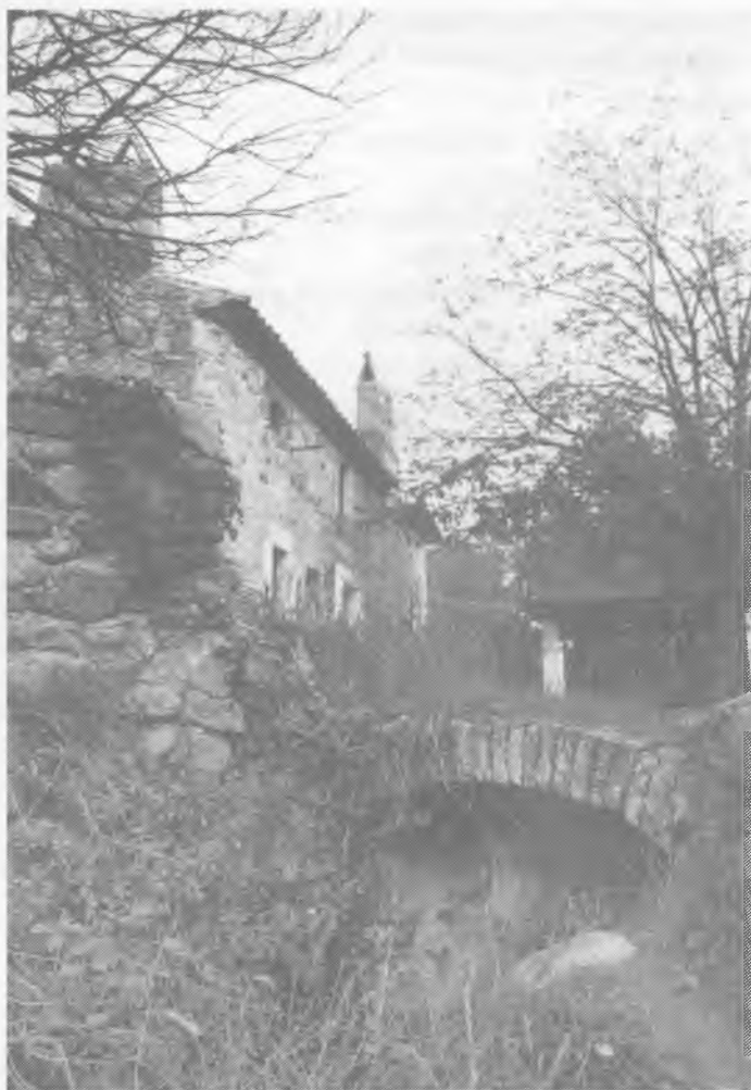
Molí d'en Parot "Molí Lluny"

S'esdevé, a vegades, que amb el pas del temps s'esborren de la memòria individual i col·lectiva fets i esdeveniments que, en llur moment, havien tingut molta importància i ressò. No és gens estrany, doncs, que els tossencs hagin oblidat un acte de rebel·lió i d'heroisme protagonitzat per un convilatà a la primera dècada del segle passat, durant la invasió napoleònica. He tingut la sort de retrobar-lo als arxius parroquials i crec que és un deure moral i cívic donar-lo a conèixer a les generacions actuals tot i