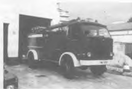
El camió més gros PEGASO tot terreny

F. COLOMER: Aquest més petit és per fer la primera arribada. Pot passar per camins estrets, és tot terreny, porta 1.000 litres d'aigua, disposa de 400 m. de mànega i els mateixos estris que l'altre.