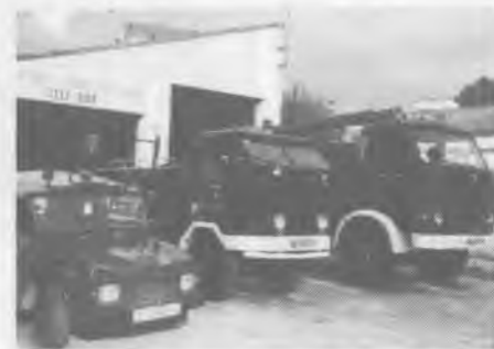
Els tres vehicles del Parc de Bombers de Tossa