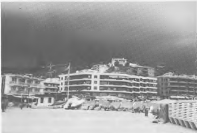
Al migdia el cel oferia aquest amenaçador aspecte que poc després es va materialitzar en una intensa tempesta

De sobte començaren a produir-se gran quantitat de llamps i sobretot trons (els llamps no eren gaire perceptibles perquè a Tossa encara feia sol) i en un principi semblà que la tempesta desfilava cap a la mar (descarregà intensament a la zona costera de Sant Feliu), però entrada la tarda i degut a les altes temperatures de l'aigua de mar, es reactivà intensament i descarregà amb gran