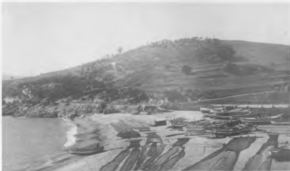
"Sa Pauma" en temps d'en Lluís Bomba.