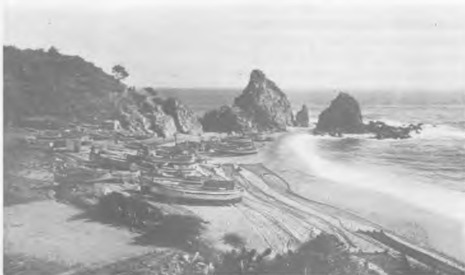
"Sa Pauma" i al fons la "Mar Menuda" en temps d'en Lluís Bomba.

és el règim interior d'aquella cala fantàstica, coneixeríem les històries d'amor i de dolor dels habitants de la mar salada, llurs plaers, sofrences, angoixes i esperances, i si, posat a parlar de fets portentosos per ell vistos en sa llarga vida de pescador, volgués exposar-los tots a la llum del sol, sabríem també que els peixos són agraïts i que en les nits de calma de l'estiu, quan dorm la vila i tota remor resta apagada, quan el far de Vila Vella dóna la rítmica salutació a les llumanetes dels sardinalers escampades per la immensa negror de la mar gran, i les aigües de la Mar Menuda es despleguen en tènue besada a la sorra fina, els roms, daurades, lluernes, serrans, esparralls i sèpies, els peixos tots, en fi, surten a flor d'aigua a remerciar al Senyor per haver-los fet néixer a