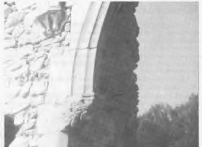
Capitell de la Capella dels Quatre Evangelistes, l'únic que encara es conserva en el seu lloc. L'àliga que simbolitza a Sant Joan porta una banda on es pot llegir: SANCTUS JOANNES.

A finals dels 70 l'església va ser l'escenari d'actuacions de Maria del Mar Bonet, Joan Manuel Serrat, Lluís Llach... en una campanya que el Grup Cultural Tossenc feia pro Casa de Cultura.