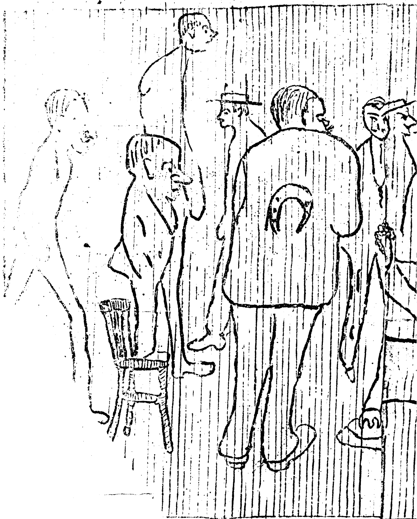
LA CAMBRA FOSCA DTRA F