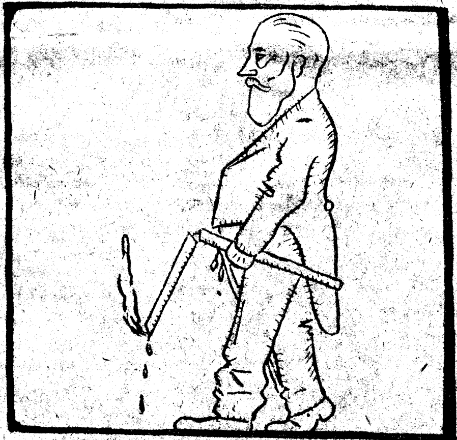
La primera autoritat porta ja'l ciri trencat!!

— Recordes que estant encare tú sota la mortal