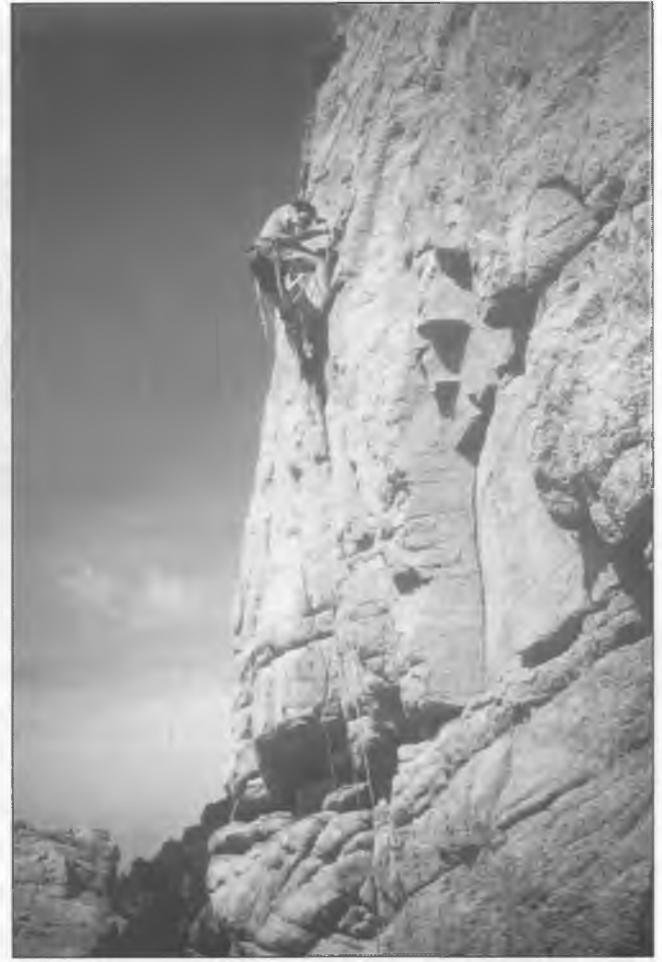
Sa Roca Tallada

Pirineus, passant per la serra de Prades, el Montsec, el Garraf, el Pedraforca, el Cadí i sobretot Montserrat, trobaràs milers de llocs, amb més o menys grau de risc, idonis per a la pràctica d'aquest esport. Montserrat ha estat, i és encara, la veritable escola catalana de l'escalada, disciplina que alguns dels mateixos monjos del Monestir venen practicant des de fa molts anys. Assolir, per exemple, el cim del Cavall Bernat, que ho fou per primera vegada l'any 1935, és com obtenir un "apte" per al qui vol endinsar-se en aquest món de l'alpinisme. Però per fer-ho no cal pas ni sortir de Tossa. Sí, a Tossa també hi ha llocs apropiats. El meu avi recorda haver sentit explicar que durant la primera guerra europea va arribar a la vila una parella procedent d'un país beligerant, ell segurament desertor, i s'instal·laren a la barra-