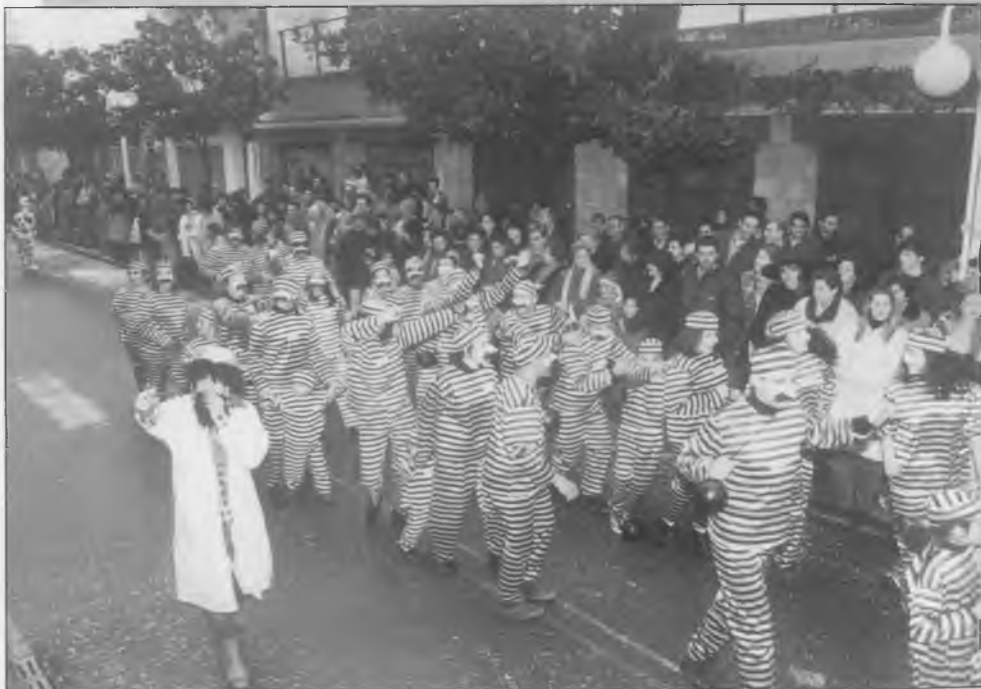
2n PREMI CRRROSSES