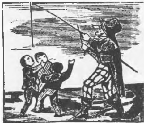
Disfressa que fa ballar la figuereta, segons una auca de festes i costums de Barcelona del segon terç del segle XIX

Cada dia hi havia passades amb música, que feia el volt gros de la vila, per anar a raure al ball a on la gent disfressada semblava presa de la follia de viure. Tothom furgava per les velles caixes de roba o armaris buscant vestits vells per abillar-se. A moltes cases benestants prestaven vestits i capells a la gent que els en demanava. Alguns s'havien fets famosos perquè no fallaven cap any. Una disfressa molt corrent i que era molt abundosa, era la que en deien de "frare". Es posaven una coixinera blanca al cap, fent de caputxa, i lligada al coll amb una veta. Del coll en avall es posaven uns enagos blancs de dona i de cintura en avall uns altres, la cara enfarinada o bé amb una careta.