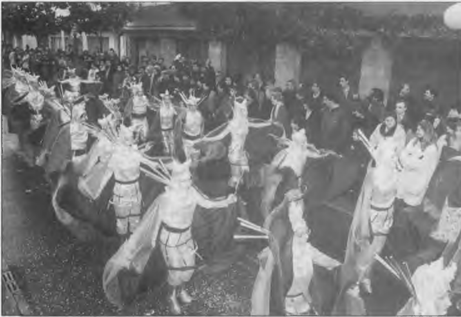
1r PREMI COMPARSES