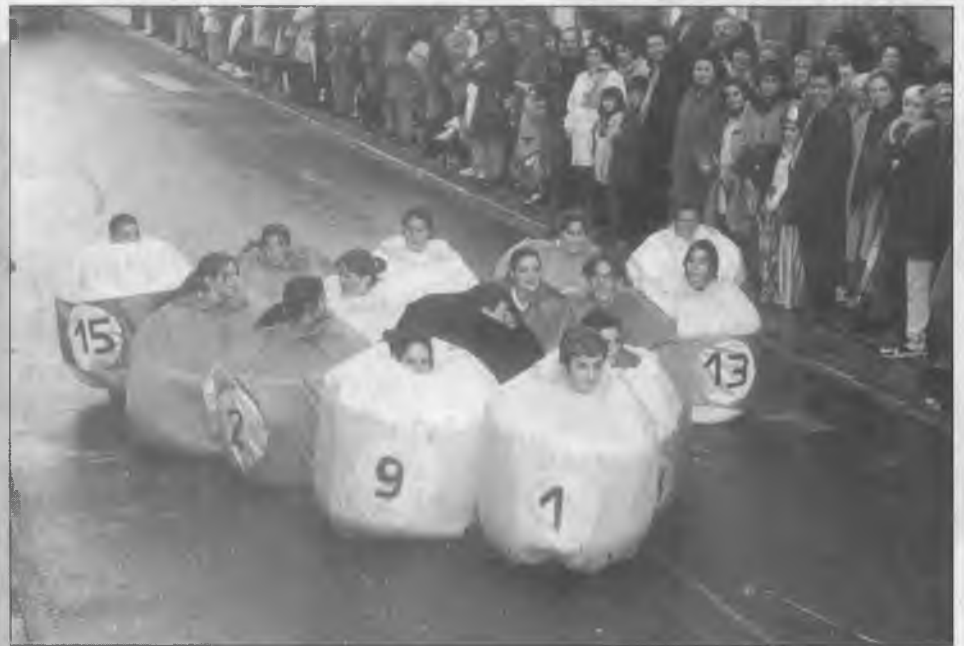
2n PREMI COMPARSES