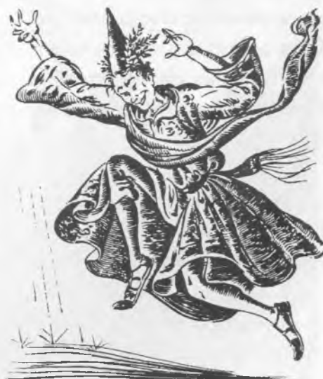
Ball de fer ploure del Bruixot de Cadaqués, a l'Empordà