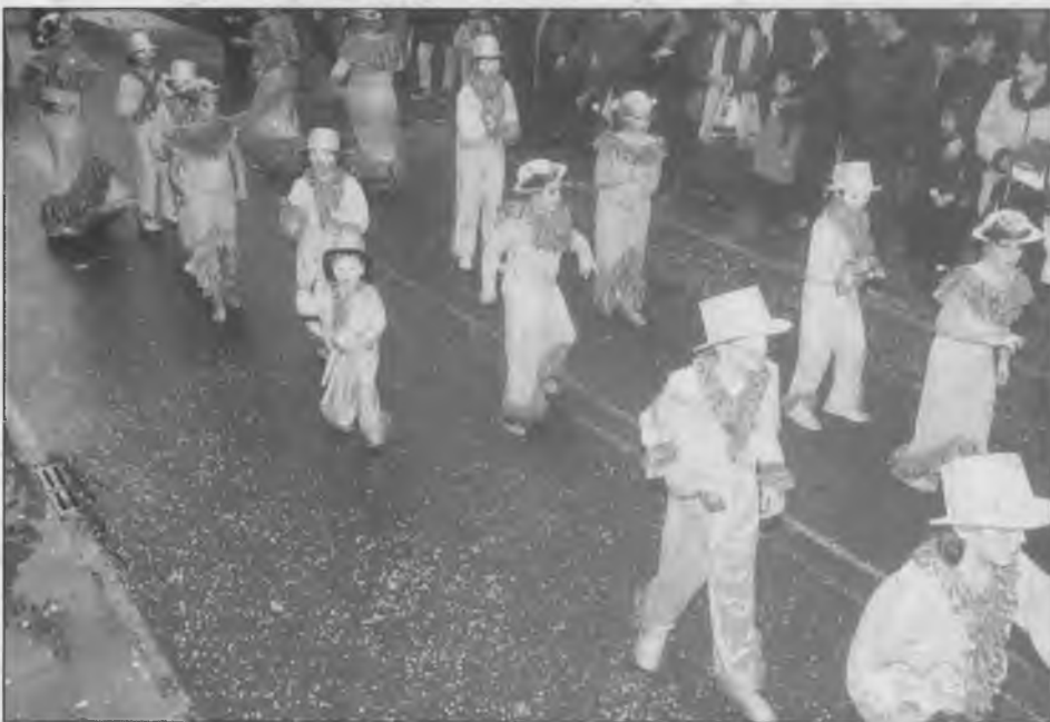
3r PREMI COMPARSES