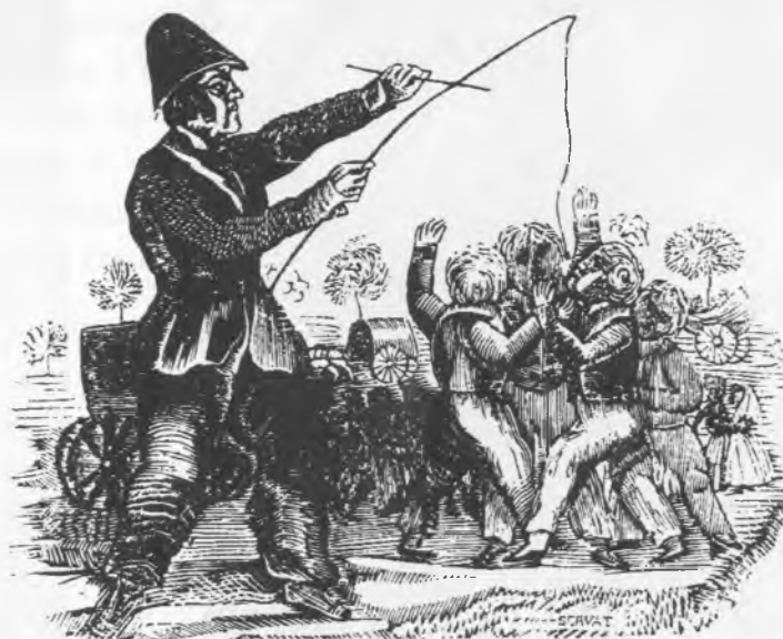
Disfressa que fa ballar la figuereta, segons un gravat de l'Enciclopèdia de Tipos y Costumbres

El poble s'omplia de cants del jovent i del perfum de les plantes aromàtiques cremades a les fogueres.