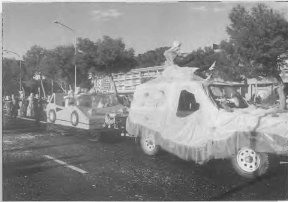
1r PREMI CARROSES