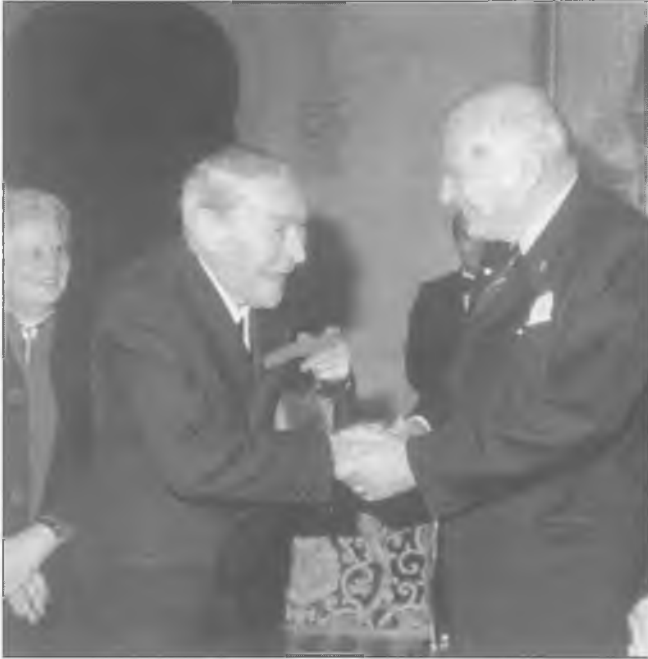
Josep Pla rebent la Medalla d'Or de la Generalitat

Pascual, republicà i lerrouxista, llavors el diari es caracteritzava pel zel i la rotunditat amb què curà de puntualitzar el moment polític i la seva posició enfront d'ell en un destacat editorial, sense signatura, com acostuma a practicar-se en l'actualitat. Uns anys més tard el diari fou adquirit pels germans Tuyà, de marcades tendències catalanistes i d'esquerres. Arribà, però, la crisi econòmica i féu agreujar la situació decadent, després de les nombroses vagues i de la mort del director; el juny de 1922 va celebrar-se la Conferència Nacional Catalana- en resultà un nou partit polític: Acció Catalana, que agrupava personalitats aïllades, disidents de la Lliga i antics catalanistes aplegant el bo i millor de la intel·lectualitat del País. En només 15 dies, catalanitzaven el diari passant a anomenar-se " La Publicitat ". Josep Pla hi treballava com a corresponal, així fou enviat per a fer de redactor per Europa.