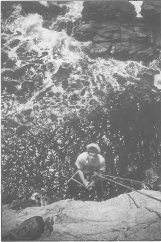
Sa Roca Tallada