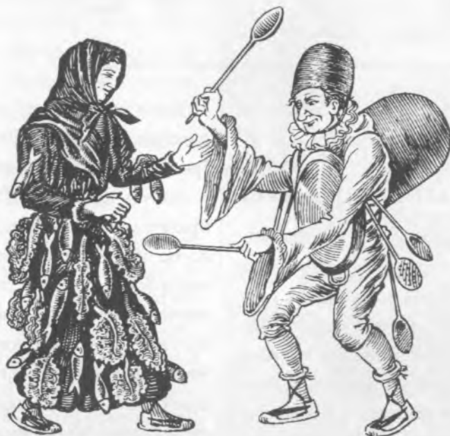
En Carnestoltes discutint amb la Quaresma

L'Avi Carnestoltes era anomenat antigament "Hivernàs" i com que els sacerdots de Saturn es vestien amb pells de llop, aquests mesos d'hivern en què la terra dormia començaven amb les "Saturnals" i acabaven amb les "Lupercàlia". Eren les vacances; les llargues vacances d'hivern.