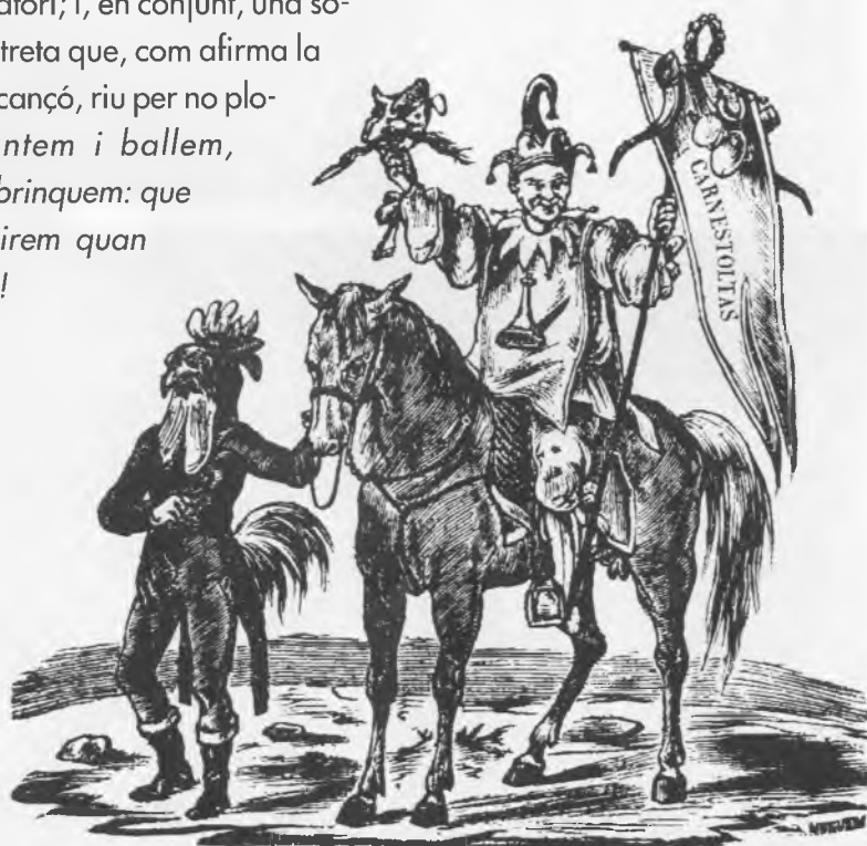
L'Herald anunciador de les Carnestoltes barcelonines amb un penó simbòlic del qual penja una banya, segons una capçalera de romaç del segon terç del segle XIX.

Oficialment, doncs, l'avi Carnestoltes va néixer ahir, regna avui i morirà demà.