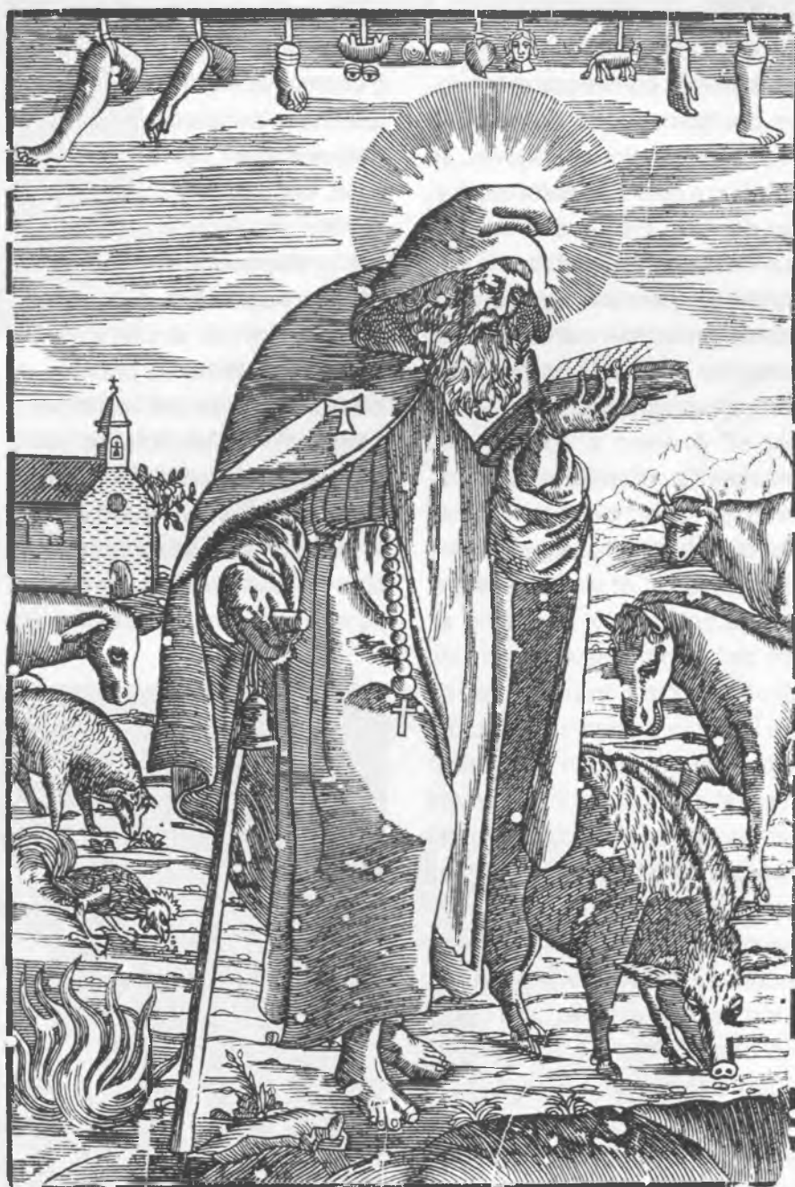
Sant Antoni Abat. Gravet al boix. Col·lecció Vicenç Esteban i Darder

El Dimecres de Cendra es feia el berenar "d'anar-lo a enterrar", però també a l'església recordaven amb la imposició de cendra l'efímera que és la vida. Uns ho tenien en compte per viure-la més intensament, altres per preparar-se per als dejunis i abstinències de la Quaresma.