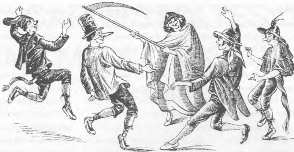
Ball de la Mort, del Ripollès, per a assegurar la collita del blat i fer trobar casador a les donzelles

Lligat a determinats ritus d'iniciació, apareix en els diversos pobles de la terra.