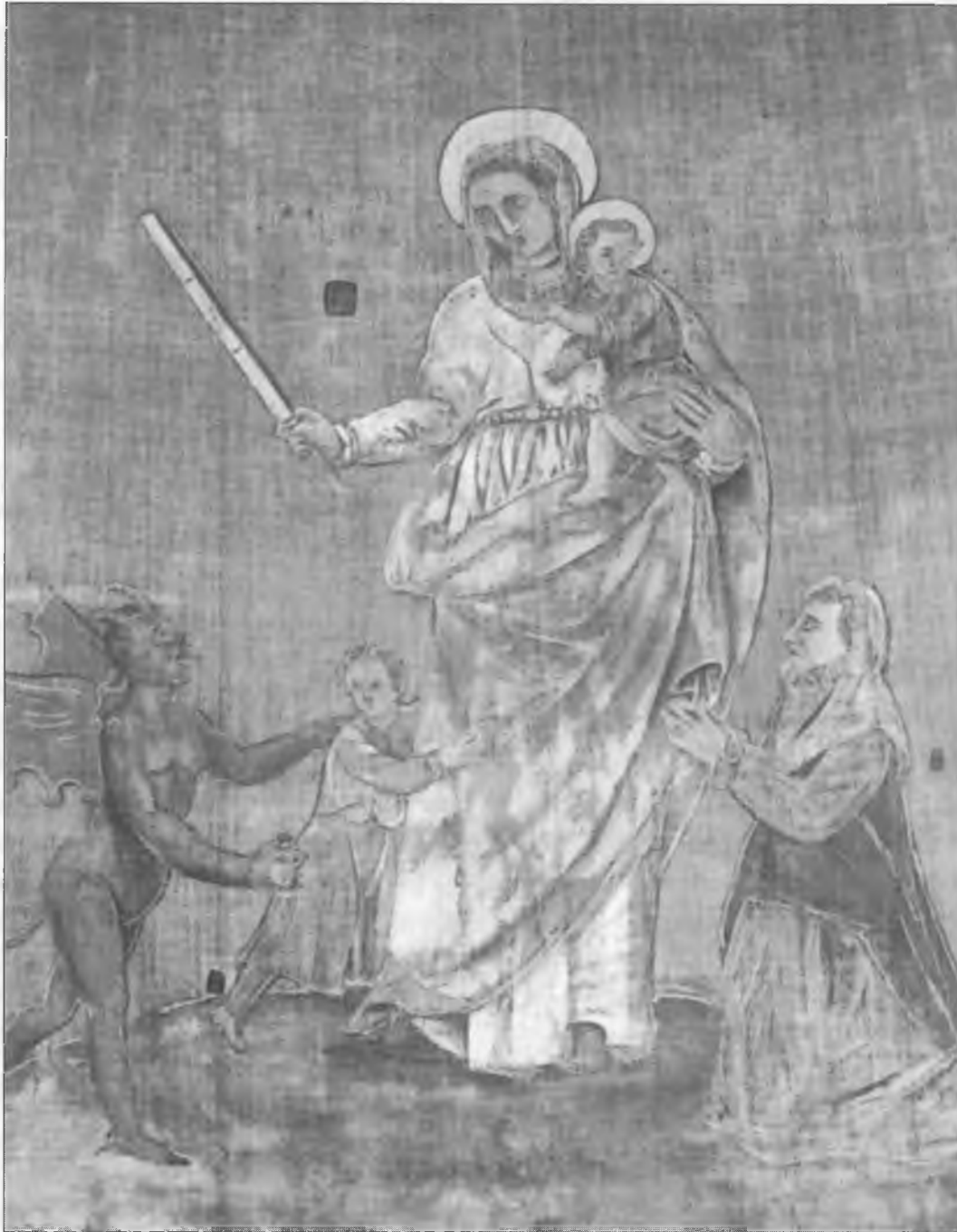
Tapís d'en Xixanet i sa mitja cana. Oli sobre tela de Josep Payet?

per a la Capella de la qual n'era el beneficiat per voluntat pròpia o per encàrrec.