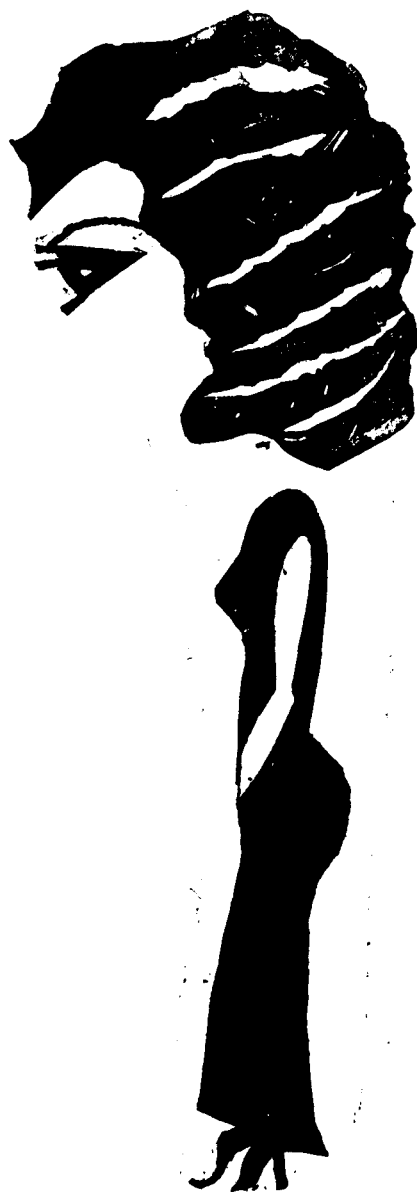
Paramount presenta a Gloria Swanson en ¡Qué Viudita!