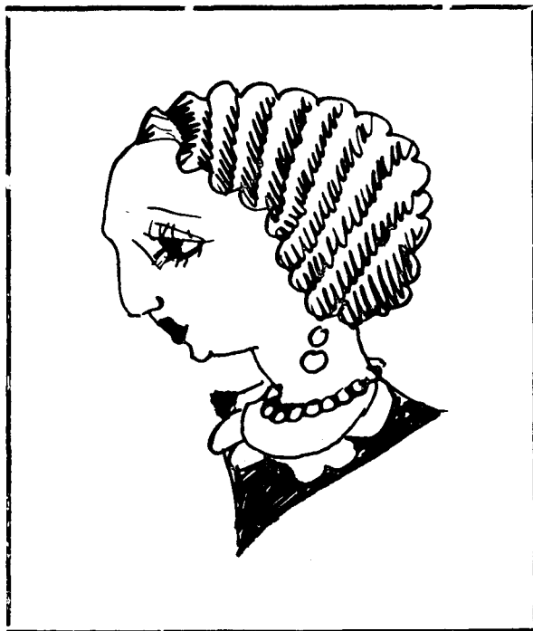
Què li donarem a la pastoreta...