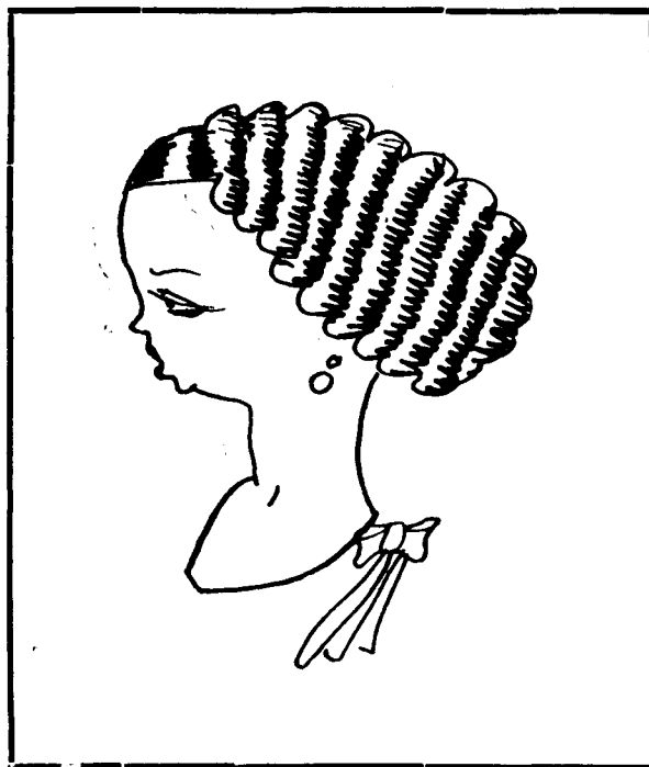
La modista més bonica del carrer nou.