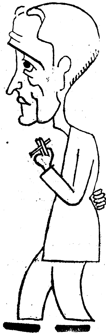
A la voreta del riu hi ha un pescador...

Compreu dissabte vinent un número molt interessant de «EL DESPERTADOR»