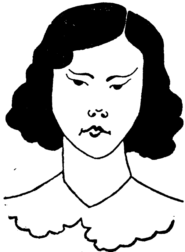
La minyona de can Gratacòs.

Camisons vermells, verds, blaus, i blancs amb tanca metàl·lica per home i nen