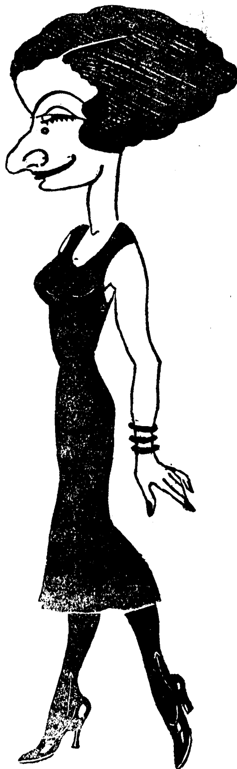
Posada en un marc la Fageda hi cab justa .