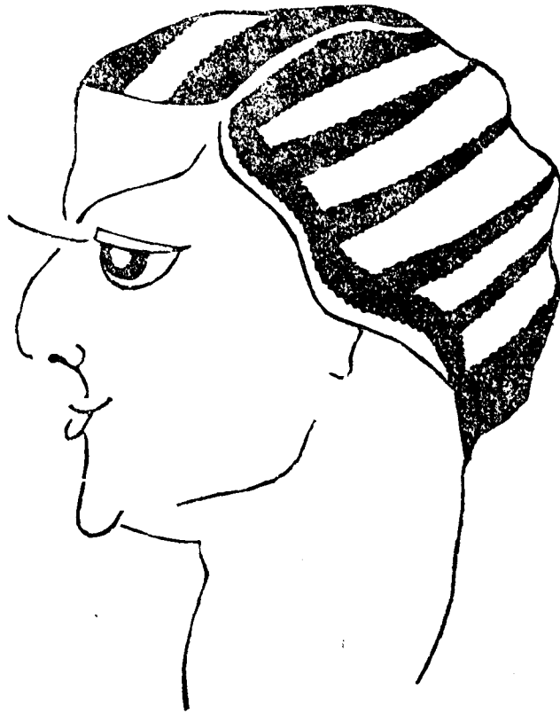
Una forastera piramidal que ens deixarà aviat.

Creiem que no hi faltaran. Nosaltres per de prompte, pensem anar-hi cada tarda de tres a set. Però tota la Redacció en pes.