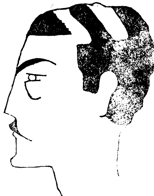
De guapo i castigador s'en ha de venir de mena.

■ INGRÉS i BATXILLER AT. Professor nadiu d'idiomes s'ofereix per ensenyar francès i anglès. Gascon.