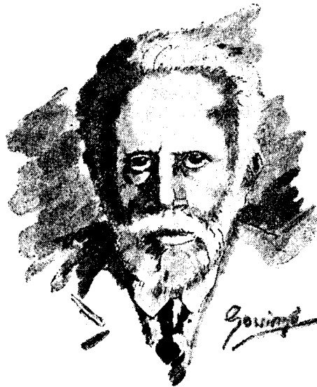
Pau Iglèsies.—(Dibuix de Gussinyer.)

El rescent trasllat dels seus restes en el panteó que en el cementiri Civil de Madrid ha costejat un sector obrer, em duu a la memòria el nom del venerable Pau Iglèsies, un dels estructuradors del Partit Socialista Espanyol.