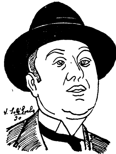
Salvador Seguí.