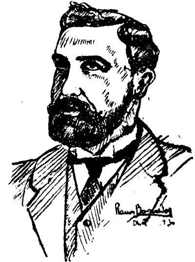
Francesc Layret.

Mai feu lluir cap més arma que la seva pluma i el seu enlairat pensament. Endebades hauria pogut valdre's del seu cos paralític i dels seus membres tullits, ni per defensa pròpia. En Layret, el defensor dels obrers, morí assassinat el 30 de novembre de 1920, quan, amb penes i treballs pujava en un cotxe per a actuar en la defensa d'un procés.