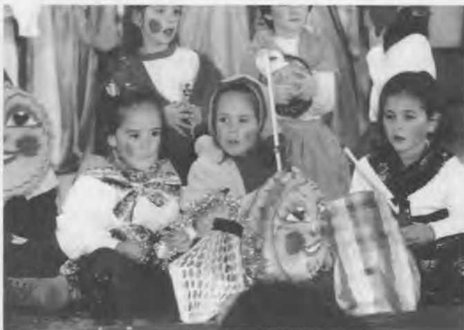
Per Nadal a l'escola cada any es fa el Festival.