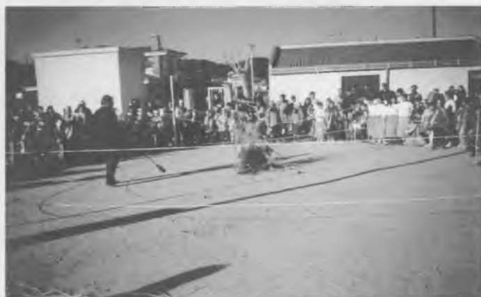
Després de fer la cercavila pels carrers del poble i llegir les acusacions, vam cremar el rei Carnestoltes.