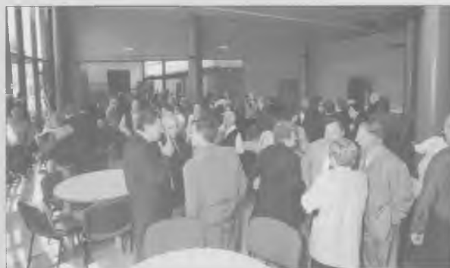
El públic assistent va recórrer les dependències del Casal d'Avis.