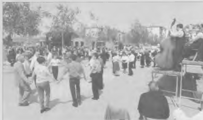
L'orquestra la Principal de la Bisbal va interpretar tres sardanes que van posar fi a la inauguració del Casal d'Avis.