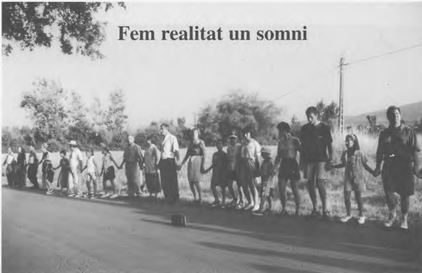
Imatge parcial de la sardana més gran del món, que es va fer el 4 de juliol de 1998 al voltant de l'Estany de Banyoles.

Era el 4 de juliol de 1998. I aquest és el títol que es va posar a una fita que es pretenia aconseguir amb dos objectius ben clars: