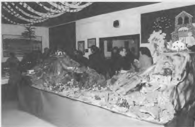
I tots els alumnes participen en la construcció del pessebre.