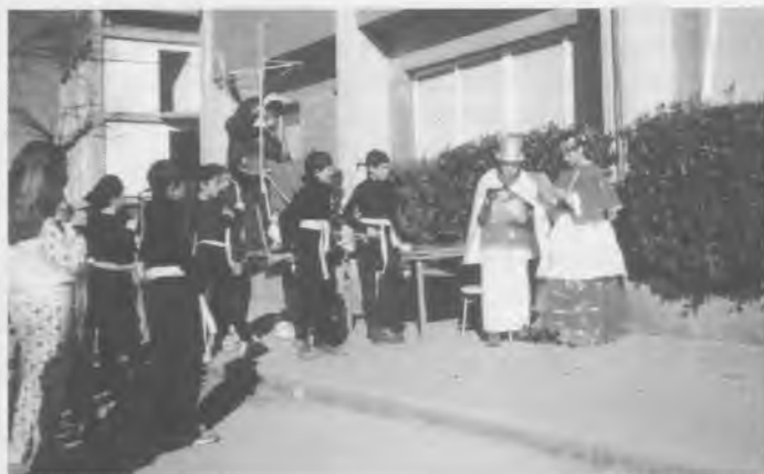
Els reis de la festa llegint el discurs d'en Carnestoltes.