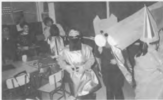
Un bon maquillatge per arrodonir la disfressa.

De fet, de tots és ben sabut que això de disfressar-se és un gran invent, només ens faltaria que ens deixessin disfressar cada dia... Ah... i que, de veritat, totes aquelles coses dolentes de les quals vam acusar en Carnestoltes, de veritat, de veritat, no tornessin mai més. ■