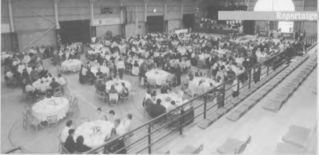
Un total de 520 persones van participar en el dinar de germanor de la Festa de la Vellesa que se celebrà al pavelló poliesportiu.

que al plegar-se permetrà disposar d'un espai que per la seva superfície, de més de 150 m 2 , és idoni per celebrar-hi festes, representacions i d'altres actes de caràcter popular i massiu.