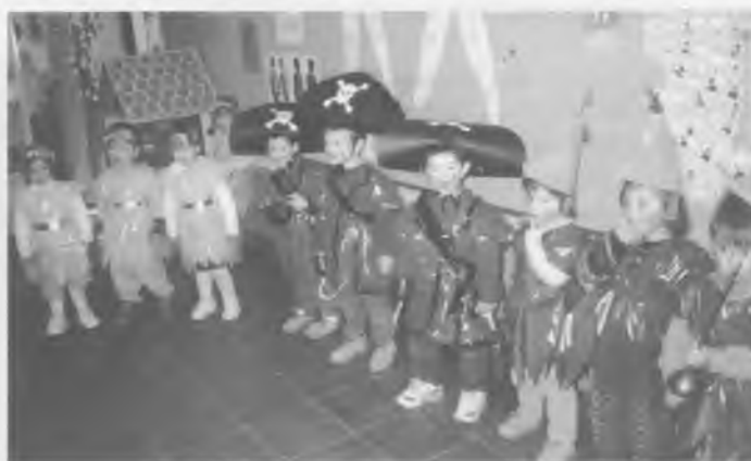
Algunes disfresses corresponien a personatges de Peter Pan, com ara el Capità Garfi.