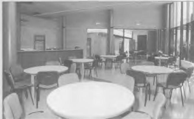
Aspecte del vestíbul del nou Casal, on hi ha el bar.

L'edifici s'ha concebut en base a un espai central plurifuncional que aconsegueix la missió d'atri i vestíbul general, al voltant del qual es desenvolupen la resta d'activitats en aquest tipus d'equipament. És per aquest motiu que hi ha una sala principal de 91'40 m 2 composta per l'accés, distribuïdor i el bar, i que a ambdues bandes se situen la sala de jocs, de taula i televisió i la sala polivalent i el menjador, ambdues de 29'48 m 2 . Aquests tres espais tenen sortida directa a l'exterior a través del porxo i resten separats entre ells per dos envans mòbils