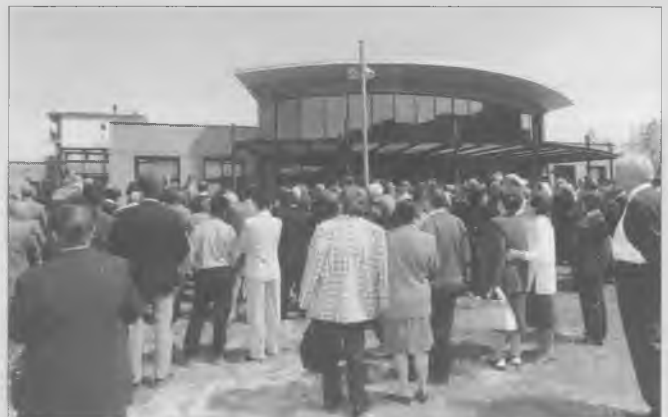
Més de 600 veïns de Bescanó van assistir a la inauguració.