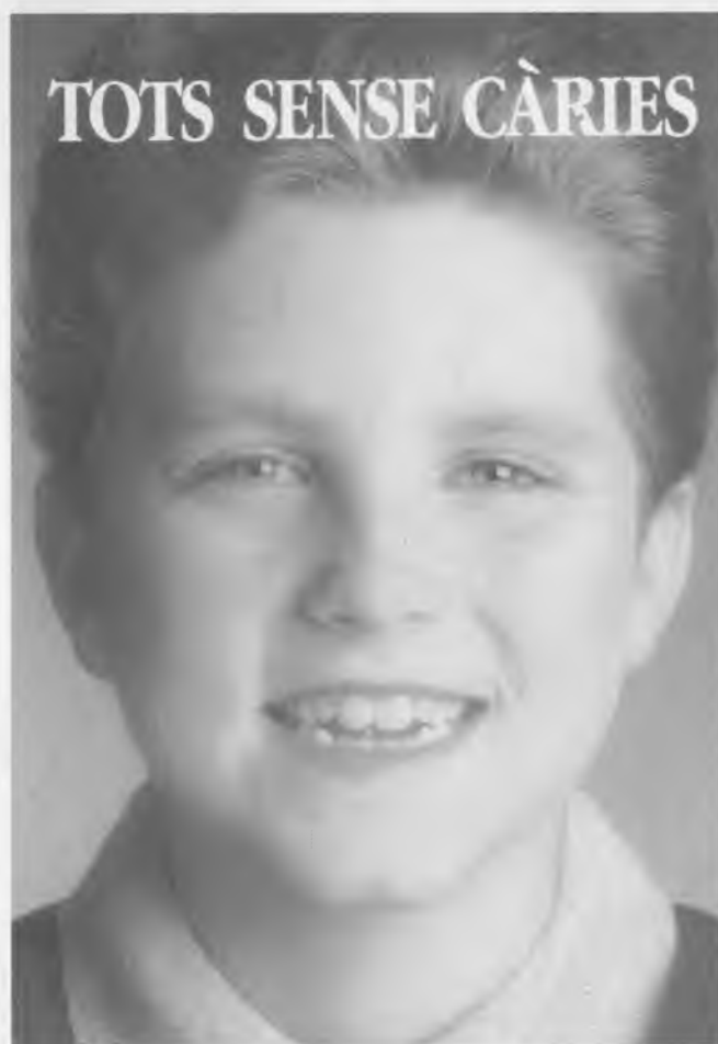
Campanya institucional contra la càries.

És una espècie de pel·lícula de bacteris enganxosa i transparent que es desenvolupa de la següent forma: Vuit hores després de la raspallada, comencen a pul·lular per les