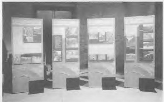
Plafons de l'exposició itinerant sobre el Projecte Alba-Ter.

Girona i Vic, estarà coordinat per l'equip tècnic i comptarà amb l'assessorament d'experts en diferents àmbits (economia, ordenació del territori, medi ambient i patrimoni) que constitueixen el Consell Assessor del Projecte Alba Ter. El pla estratègic ha de recollir també les propostes del món empresarial i sindical, dels agricultors, dels col·legis professionals, dels ecologistes i de les entitats cíviques i culturals, entre d'altres.