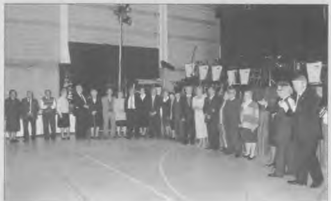
Matrimonis del poble que durant el bienni 1998-1999 celebren el 50è aniversari del seu casament.