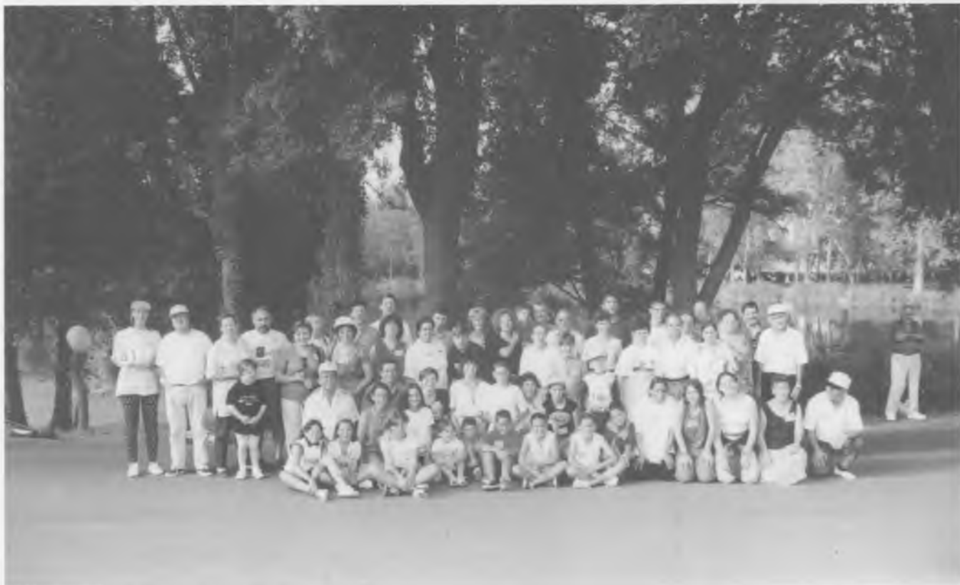
Entre els 14.131 balladors de sardanes que van fer l'anella que envoltava totalment l'Estany de Banyoles n'hi havia una cinquantena de Bescanó (a la fotografia).

quals es va lliurar obsequis després d'haver ballat tres sardanes.