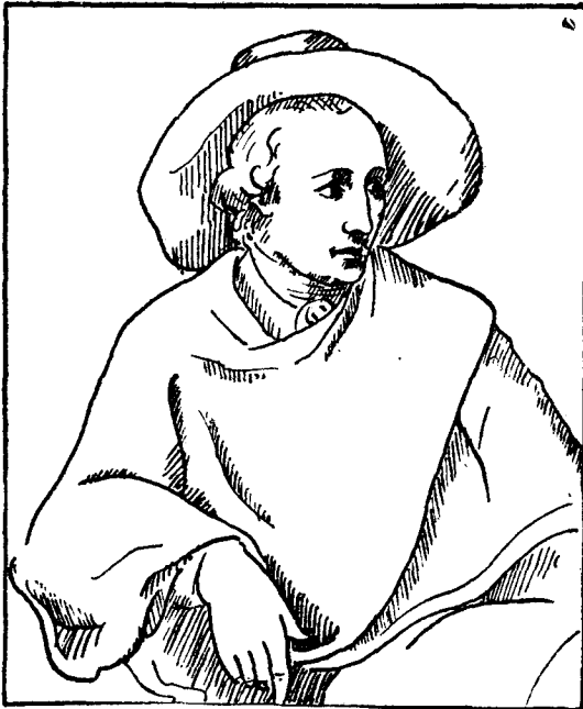
Joan Wolfgang Goethe. (1749 - 1832) (Apunt tret del quadre de W. Tischbein.)

Aquesta nit he estat a casa de Goethe quan començaven a encendre els llums, l'he trobat d'un ànim gai i despert; els seus ulls brillaven al resplandor de la llum i tot ell irradiava alegria, força i joventut. Començà parlant-me de les poesies que li havia lliurat el dia abans, mentre passejàvem per l'habitació.