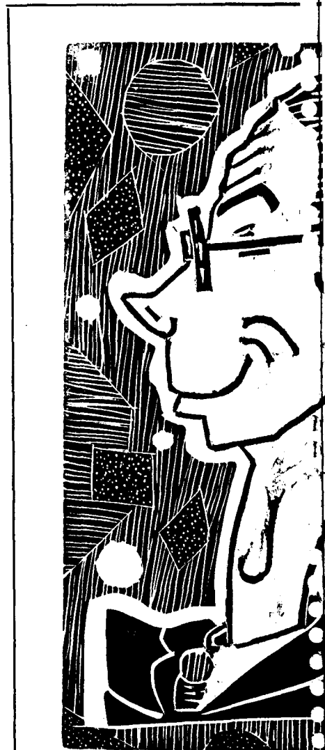
Un castigador que és palla no

■ El mussol és un animal que sempre s'amaga.