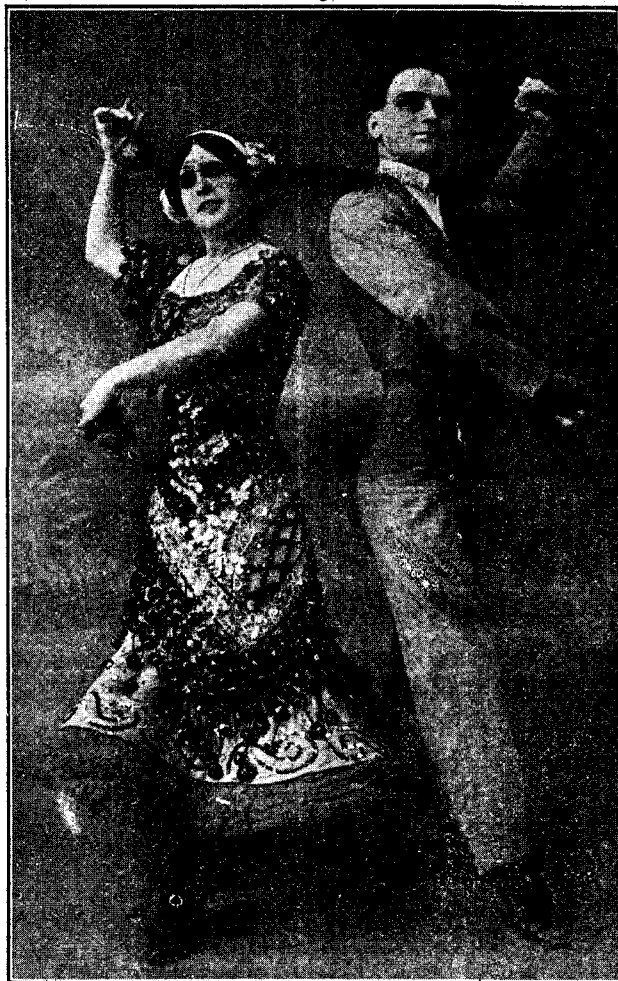
GRAN PAREJA DE BAILE