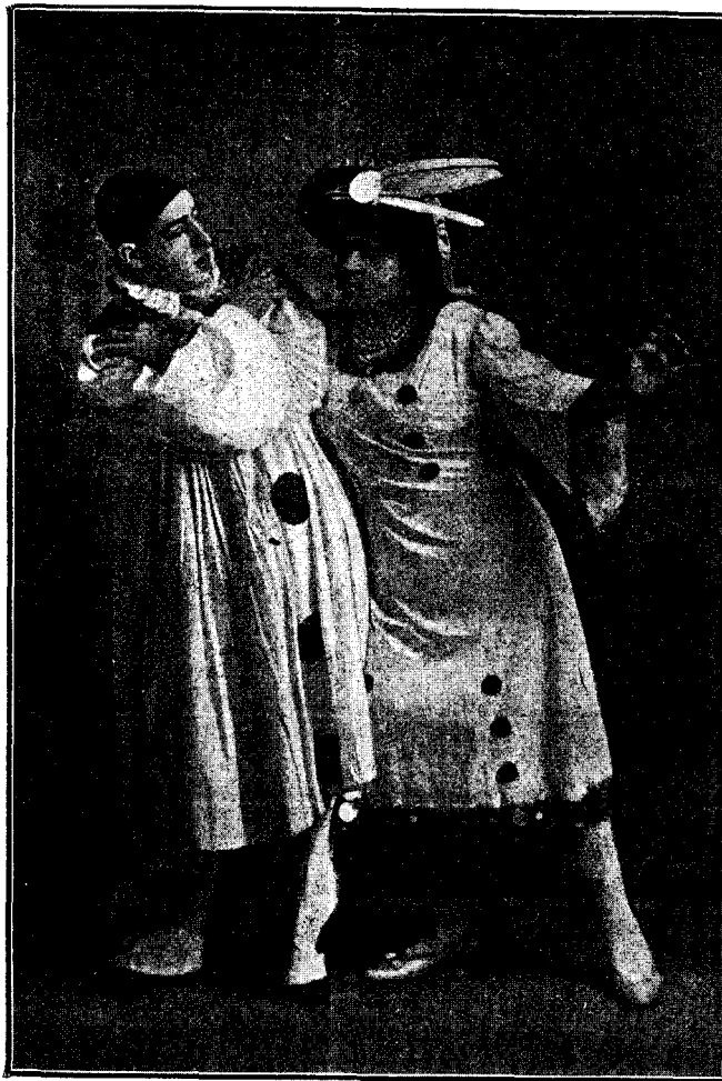
DUETISTAS SERIOS A CRAV VOZ Y A TRANSFORMACIÓN