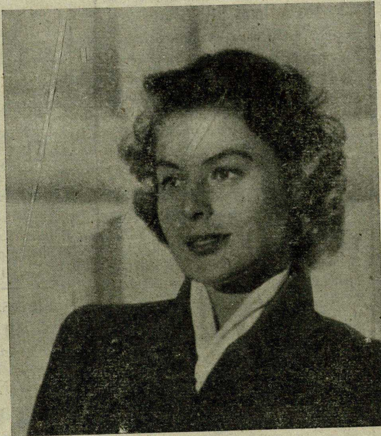
INGRID BERGMAN, la genial intérprete de "Juana de Arco", que pronto veremos en nuestras pantallas

Con todos los ingredientes necesarios—incluso pieles rojas—los americanos han creado una historia cuya novedad consistirá en ofrecer rostros casi olvidados y trucos que emocionaron nuestros años mozos.—SPLAY