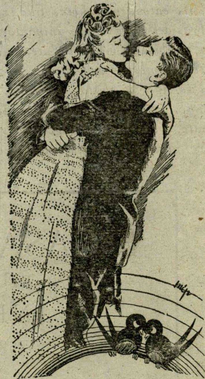
Glenn Ford y Evelyn Keyes, en «El hombre de mis amores» film de estreno en nuestra ciudad.