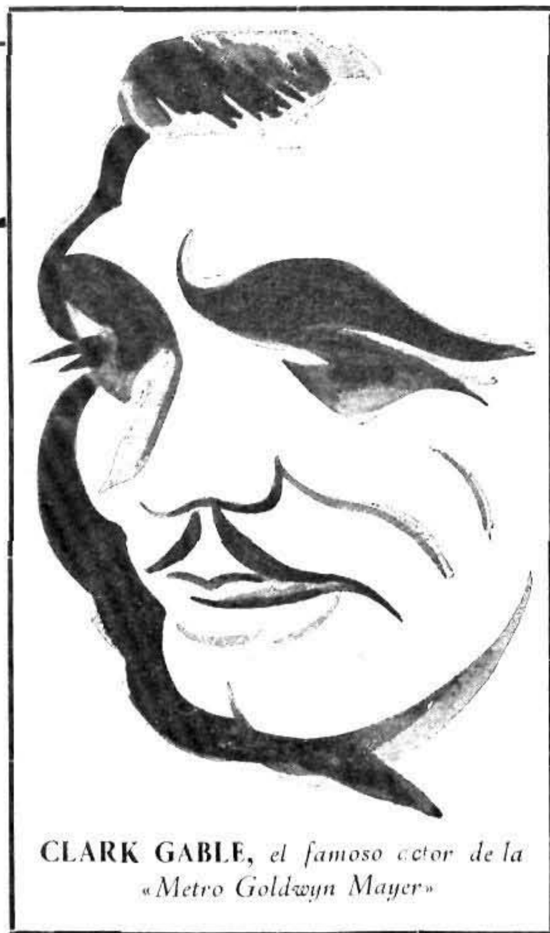
CLARK GABLE, el famoso actor de la «Metro Goldwyn Mayer»