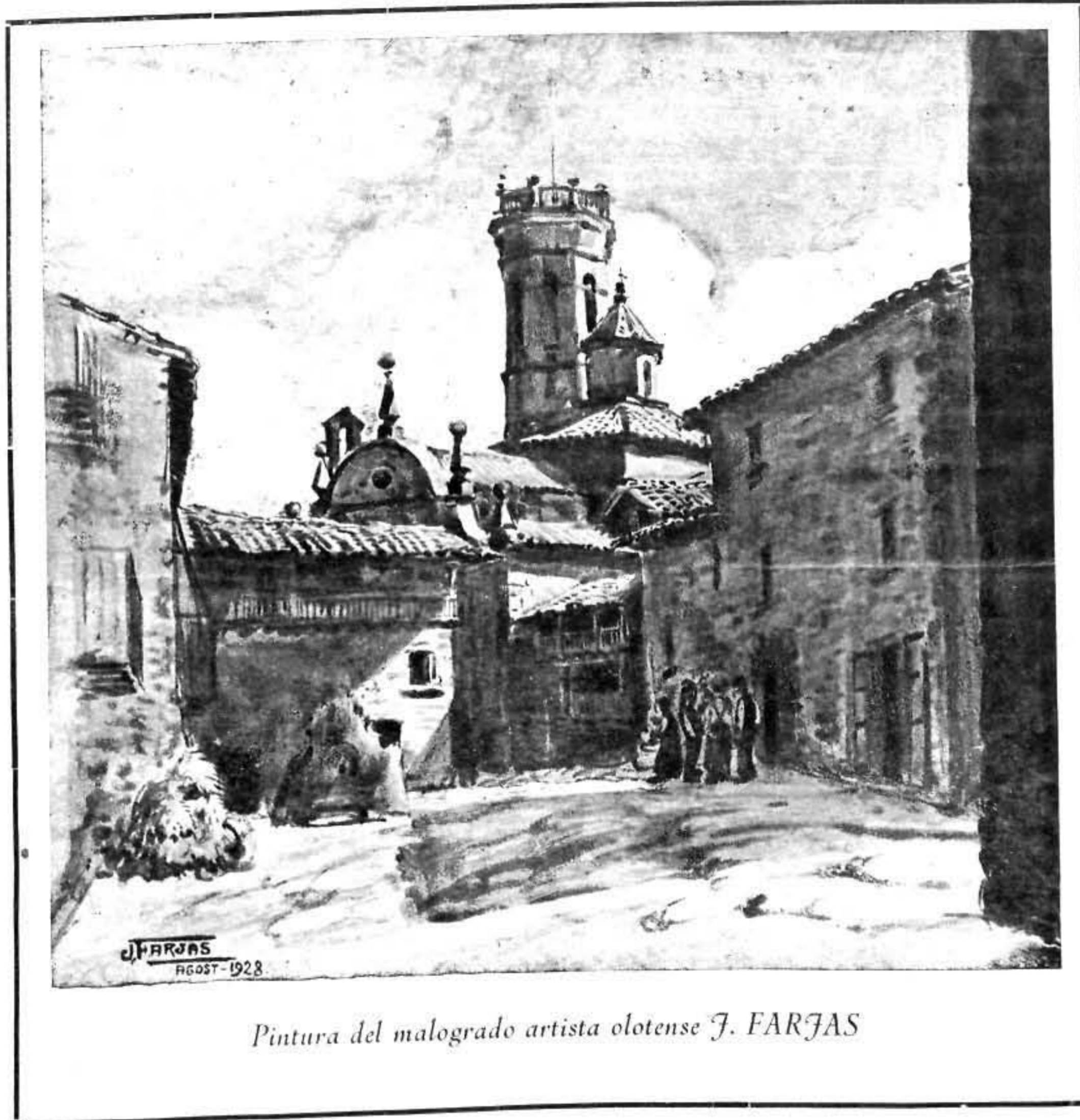
Pintura del malogrado artista olotense J. FARJAS

a lograr. Sin embargo, ¿cuán divergente es el país que tiene emoción en lo más hondo, que manifiesta una educación de los sentimientos y una avidez intelectual. Trátase, entonces, de un pueblo poseedor nada menos que de una predisposición efectiva a todo lo cultural y sobre todo al Arte.