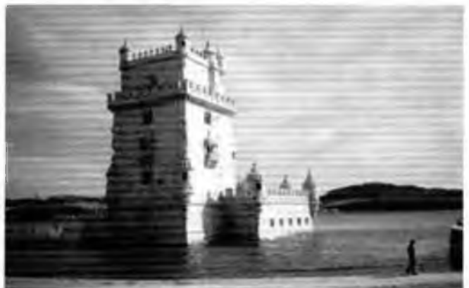
Torre Belem de Lisboa.