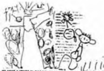
VA ANAR A VEURE EL BOSC DEL BOSC. VORREY SI VA BONA LA FORMULA MÀGICA. PATAPLUF, PATAPLUF, A TORNAR CASTANYES DEL BOSC.