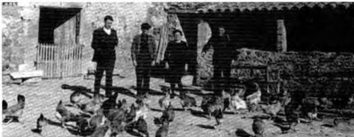
Característica estampa de les cases de pagès amb la viram a l'entrada de la casa.