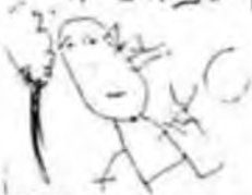
UNA JERARCA DE PASTA UNA CASTANYERA QUE SE VA ANAR A COLLIR CASTANYES DEL BOSC.