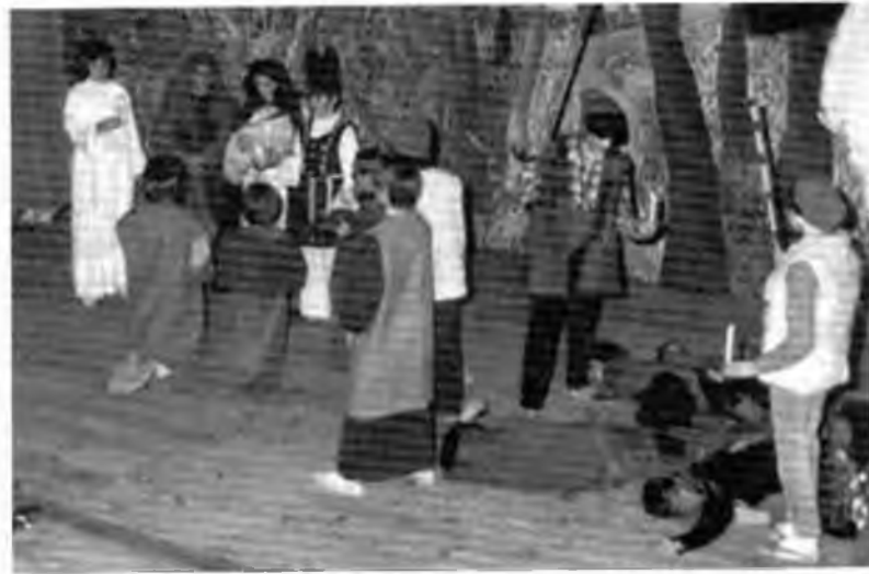
Adaptació dels Pastorets de Folch i Torres, 1985.