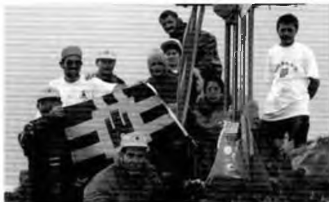
Al cim de la Pica d'Estats amb el Grup Excursionista.