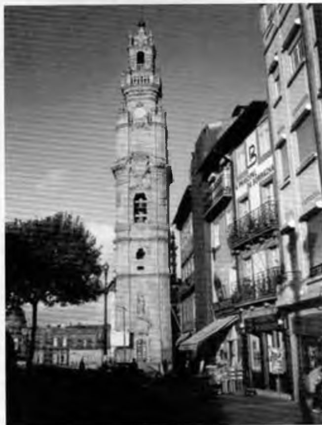
Torre Dos Clerigos a Porto.

El segon dia el vam dedicar als barris de la Baixa i