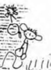
LES CASTANYES CAUEN LA CASTANYERA. MUELL CASTANYES I VA CAP A DUTAT A VERMELLES.