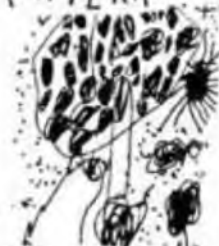
PER EL CASTANYER SE DIBUXA LES SEVES CASTANYES.