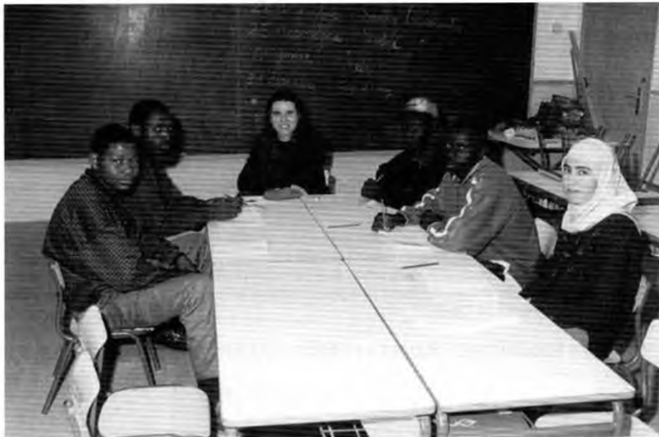
Alguns alumnes de les classes d'alfabetització per a persones immigrades (Foto Estudi Albert).