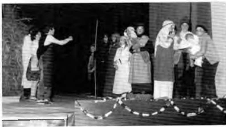
Els Pastorets del Ferrer Magí, 1984.