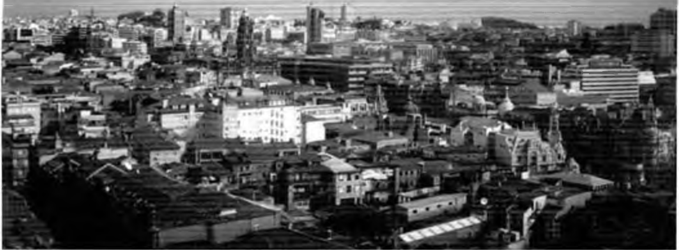
Paisatge de la ciutat de Porto.

L'altre barri, l'Alfama, és el pol oposat del que acabem de veure. És una zona amb carrers estrets i empedrats, amb deplorables cases apinyades unes contra les altres i amb grans pendents. La vida quotidiana gira entorn als petits comerços i tavernes del barri, i en la part més alta sobresurt l'imponent Castelo de Sao Jorge (Castell de Sant Jordi). És un barri de l'Edat Mitjana dominat per un creixement orgànic de la ciutat, on com hem dit abans, els carrers són estrets i, a més, s'entrecreuen entre si sense cap solta ni volta. També hi ha altres construccions importants com les dues torres de la Sé (Catedral de Lisboa) i la cúpula de l'església de Santa Engràcia.