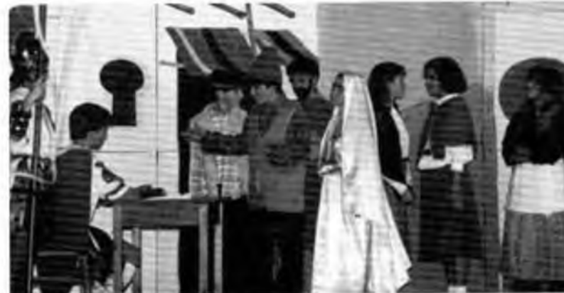
Estrena de Les desventures de Llucifer, 1989.