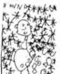
LA CASTANYERA ARRIBA LA VIT I ANA EL CASTELL NOU. MOLT CONTENTA CAP A TORNAR PARA SEVA SE VA A BORDA.