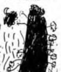
I SET ABUT UN BAY, VET ABUT UN BAY ABUSET COME I NA FOR. I SET ABUT UN BAY, VET ABUT UN BAY ABUSET COME I NA ALABATI.