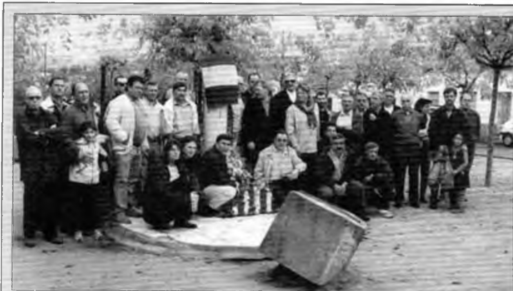
Homenatge al president Lluís Companys el 15 d'octubre del 2000 en el 60è aniversari del seu afusellament.

En l'àmbit universitari, a més de catedràtic de l'Escola Universitària d'Estudis Empresarials a Santa Cruz de Tenerife, Las Palmas, Santa Cruz de Tenerife i Barcelona, successivament, fou professor de grec de la Universitat de Barcelona des de 1946 fins a 1955 i de grec o de francès entre 1955 i 1962 a Barcelona i de 1963 a 1970 a la Universitat de la Laguna. També va ser professor extraordinari de l'European Business School. ■