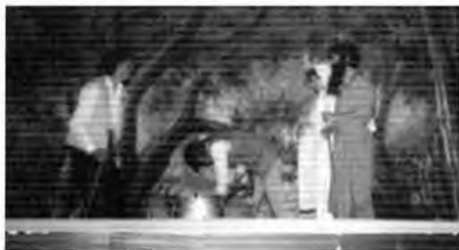
La Flor de Nadal, 1975.

Aquest article pretèn aportar unes quantes dades que, a manera de fites, delimitin les etapes principals de la història dels Pastorets a Vidreres. No aspira, perquè és pràcticament impossible, ni a esgotar el tema ni a donar totes les referències i noms sobre aquesta activitat teatral al nostre poble. Serà, per tant, un recorregut parcial, personal, amarat d'una nostàlgia poc dissimulada, però que pot ser significatiu per a les persones que en un moment o altre han estat relacionades amb aquesta manifestació de teatre popular, ja sigui com a intèrprets, com a col·laboradors o purament com a espectadors. Són 21 anys de representacions, però en realitat la història s'ha d'iniciar 27 anys enrere, ja que hi ha hagut un parell d'interrupcions de tres anys cadascuna, circumstància que ens permet diferenciar-hi tres etapes ben concretes.