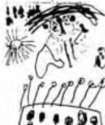
ARRIBA A LA SEVA PRADA DE LA PLAGA I HO FRED DE VERDE FINE QUE EL BOSC SE VA.