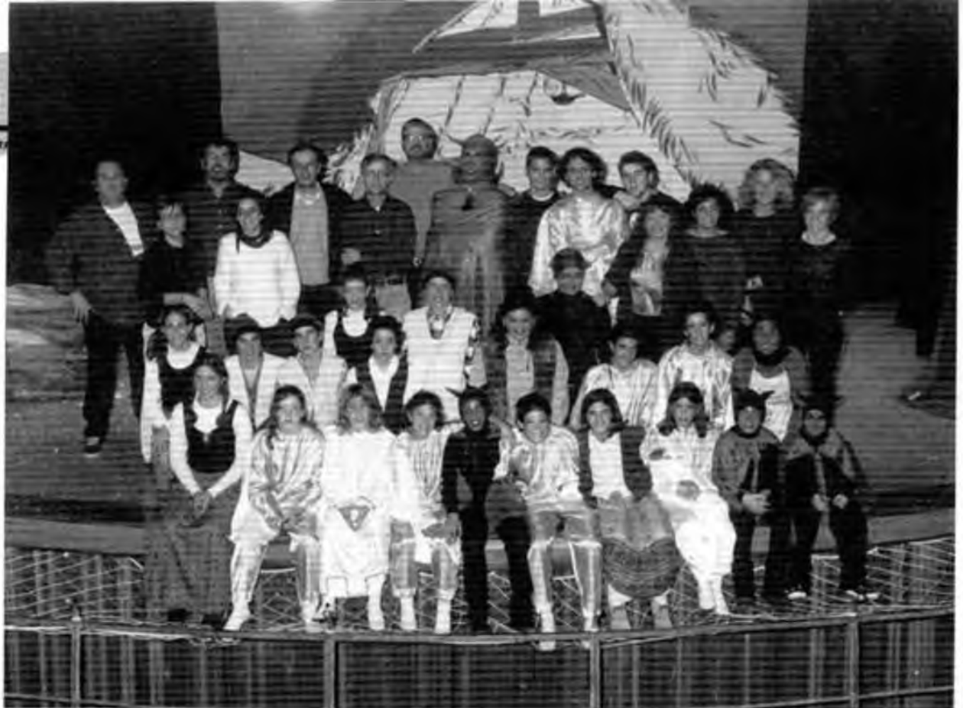
La companyia actual, el dia de Sant Esteve de 2000.

de Vidreres: l'escenificació d'obres pròpies. La primera va ser l'any 1987, Els viatgers del temps , una obra amb un cert aire futurista, que va provocar el següent comentari, caçat al vol entre el públic: "Això són pastorets americans". De l'any 1988 data l'obra L'estrella d'orient , en la qual apareixia per primer cop el camell de quatre geps dels reis mags; des d'aleshores cada representació dels Pastorets compta, en un moment o altre, amb l'aparició d'aquest singular animal. I el 1989 es va estrenar Les desventures de Lucifer , muntatge que va aconseguir un accèssit en el concurs "Teatre a l'escola" del consell Comarcal.