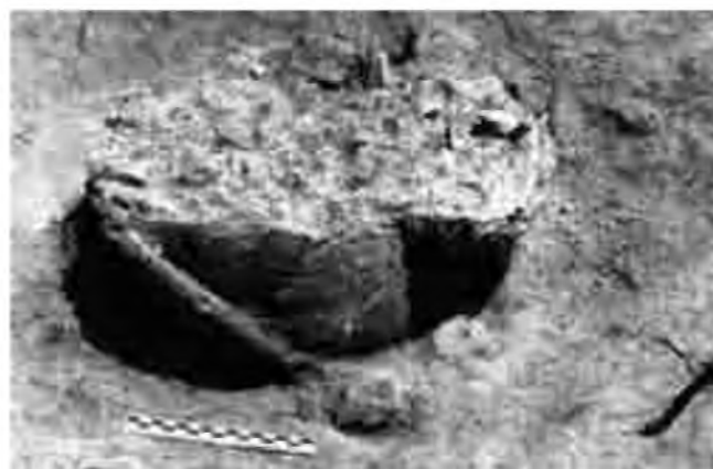
Un detall de l'enterrament E-23. Sota l'urna cinerària decorada es va col·locar una plata protectora.

Un fet a destacar és que la majoria de les urnes estan molt decorades, des de la vora de la boca fins a la carena,