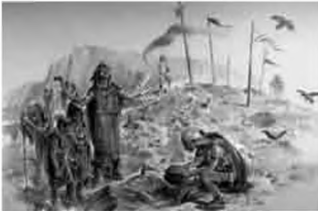
Recreació d'una escena de la cerimònia del ritual de la incineració.

amb uns motius geomètrics de meandres que simbolitzen els rius i també figures antropomorfes, amb una tècnica incisiva de traç múltiple amb incrustacions a dins el solc pigments de color vermell.