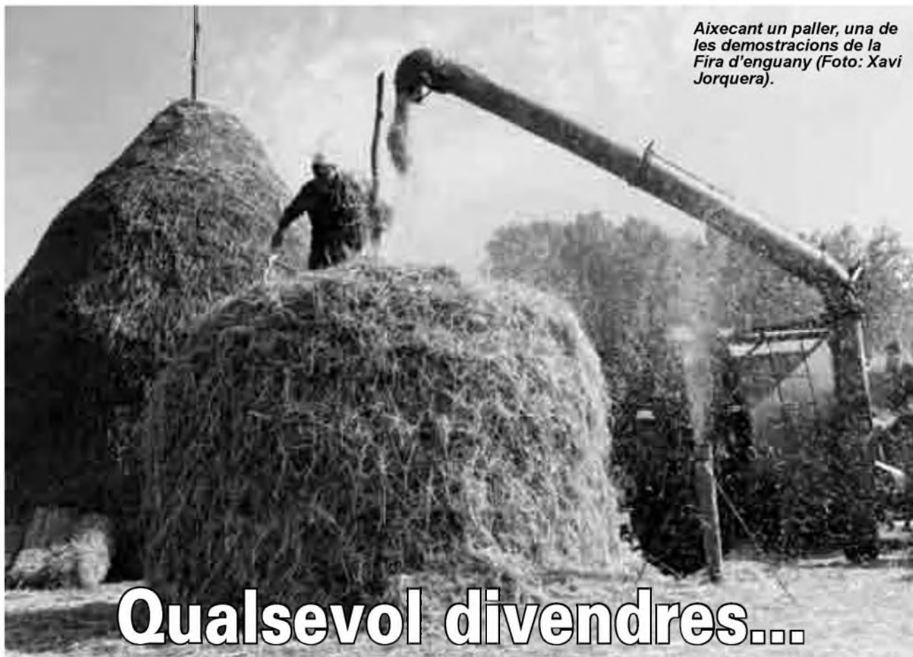
Aixecant un paller, una de les demostracions de la Fira d'enguany.