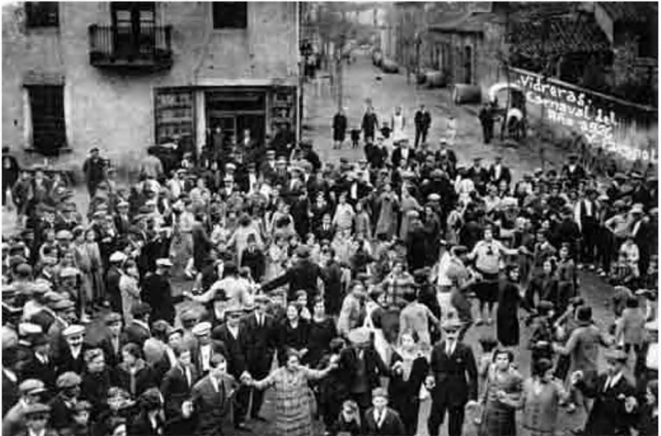
Vista dels actuals carrer Pau Casals i plaça Lluís Companys l'any 1926, que aleshores s'anomenaven carrer de Sans i plaça Nova (Foto: Arxiu Històric Comarcal de Santa Coloma de Farners).

de 252 habitants el 1718 a 546 habitants el 1787, així s'edificaren noves cases i als carrers anteriors en aquest segle s'afegiren el carrer Nou i un carreró (c. Sense Sortida).