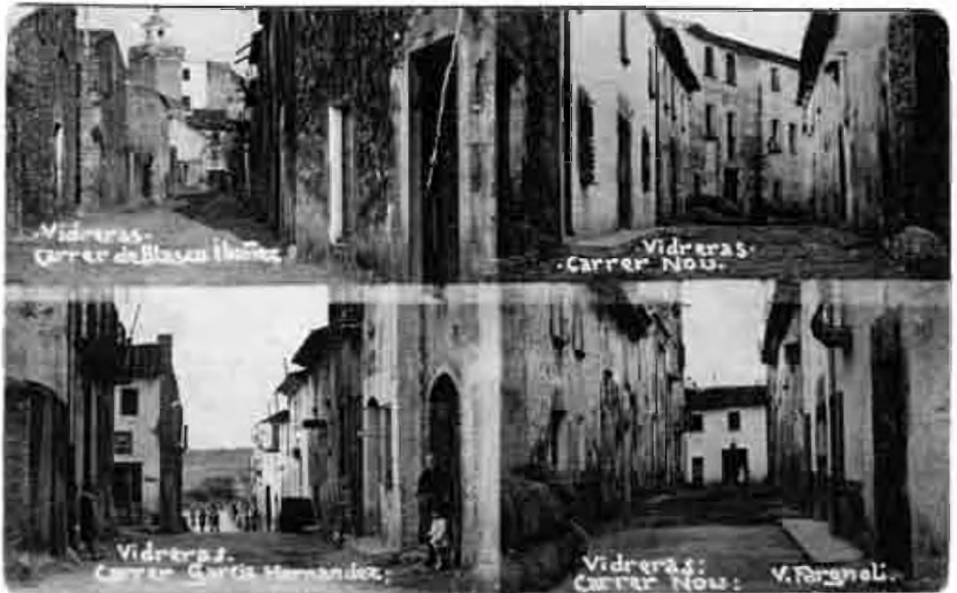
Vista dels actuals carrers de Ponent, Nou i Pompeu Fabra entre els anys 1913-33, en aquell temps anomenats carrers de Blasco Ibáñez, Nou i García Hernández, respectivament (Foto: Arxiu Històric Comarcal de Santa Coloma de Farners).