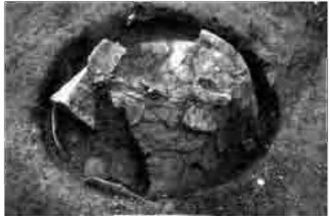
Urna cinerària dins la fossa excavada en el sauló (enterrament E-28).

En definitiva, segurament ens trobem davant de dues poblacions: una de migratòria pastorívola i ramadera que hauria enterrat els seus morts al Pi de la Lliura, i una altra de més o menys sedentària dedicada a l'explotació agropecuària. Totes dues haurien viscut pels volts de Vidreres a les darreries del bronze final, ara farà uns 3.000 anys. Les característiques de les urnes cineràries, que són els referents més útils, ara per ara, per identificar la població, ens assenyalen que es tracta d'una de les necròpolis d'incine-