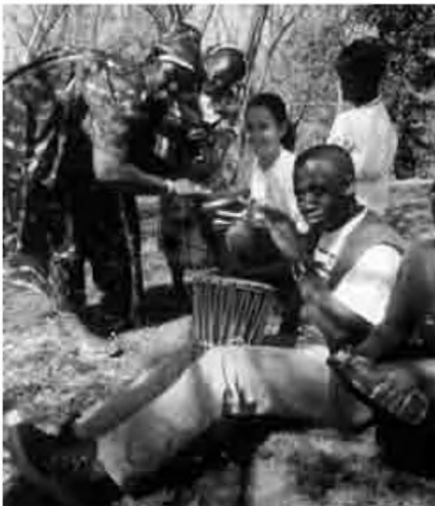
L'excursió del dia 4 d'abril a Banyoles, Olot i Besalú.