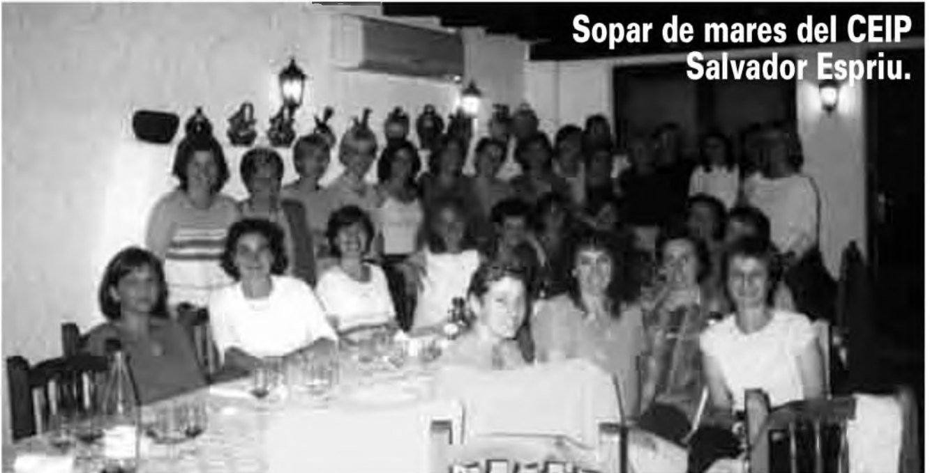
Sopar de mares del CEIP Salvador Espriu.