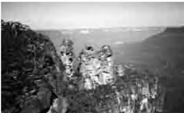
Muntanyes Blaves, situades a les rodalies de Sydney.