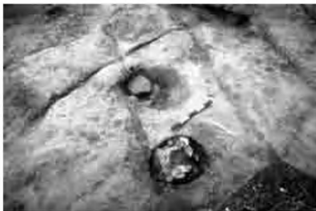
Dos enterraments excavats posteriorment a les rases que formen una retícula al subsòl. Indicis d'un sistema de cultiu antic?

per a la necròpolis de l'any 950 aC, una datació força més antiga en relació a la que estàvem acostumats a utilitzar.