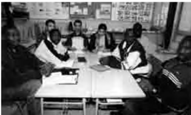
Unes setanta persones participen a les classes d'alfabetització, repartides en diferents grups.