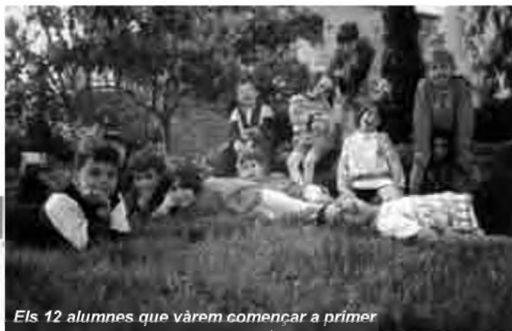
Els 12 alumnes que vàrem començar a primer