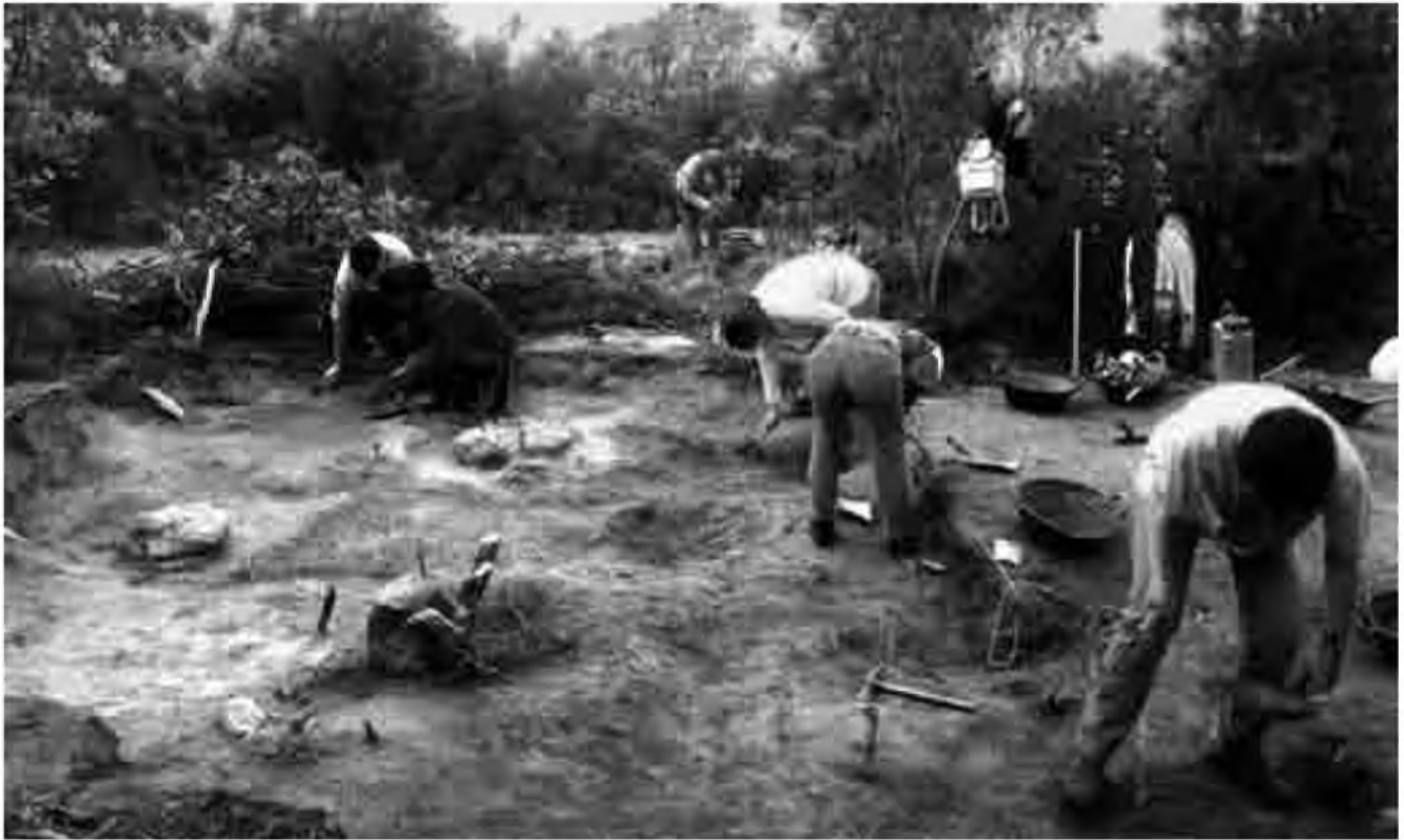
Aspecte del procés d'excavació al Pi de la Lliura 2001.