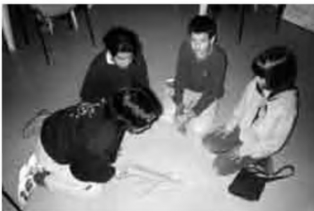
El primer Cap de Setmana Intercultural se celebrà coincidint amb Sant Jordi.