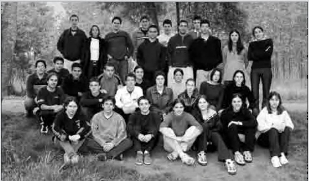
Alumnes de 2n de batxillerat de l'IES de Vidreres.