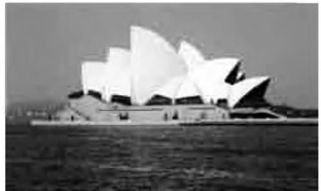
L'Òpera House, a la badia de Sydney.