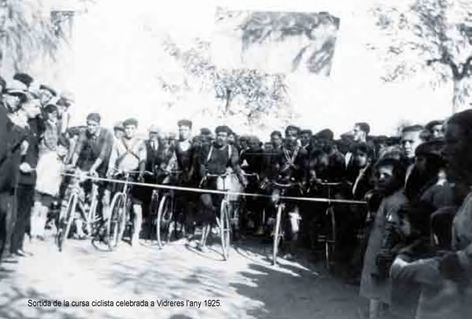
Sortida de la cursa ciclista celebrada a Vidreres l'any 1925.