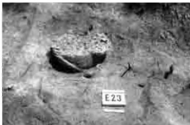
L'enterrament E-23 al mig d'un requadre de la retícula excavada al subsòl.