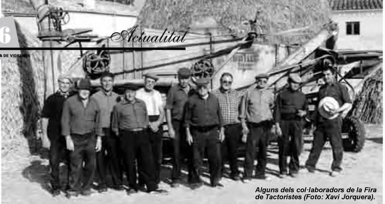
Alguns dels col·laboradors de la Fira de Tactoristes (Foto: Xavi Jorquera).

arribar a dalt?". Algú pregunta: "Ja heu pensat en la fondària de la pallissa? Penseu que abans hi cabia un carro i un matxo!".