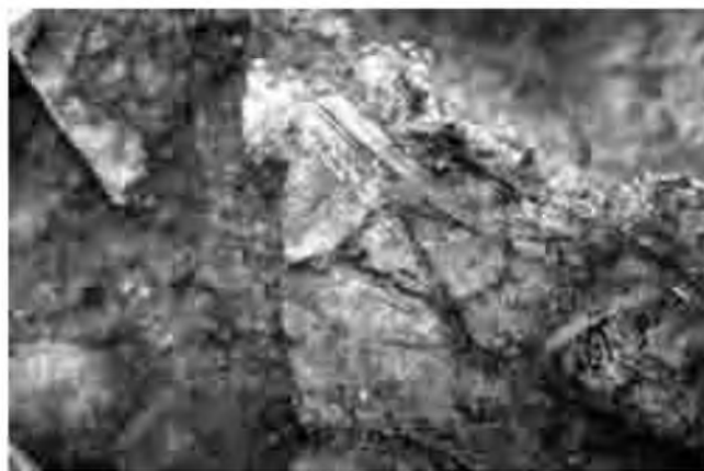
Detall de la decoració de l'urna cinerària de l'enterrament E-28.

El procediment a seguir va ser realitzar, a l'atzar, uns