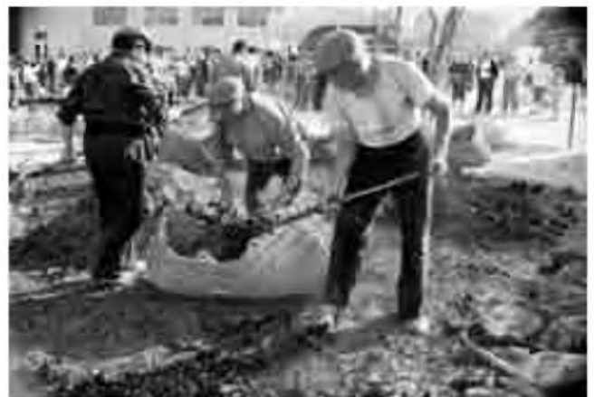
Fent carbó, una altra demostració de la Fira d'aquest any.

COMISSIÓ DE LA FIRA DE TRACTORISTES DE VIDRERES