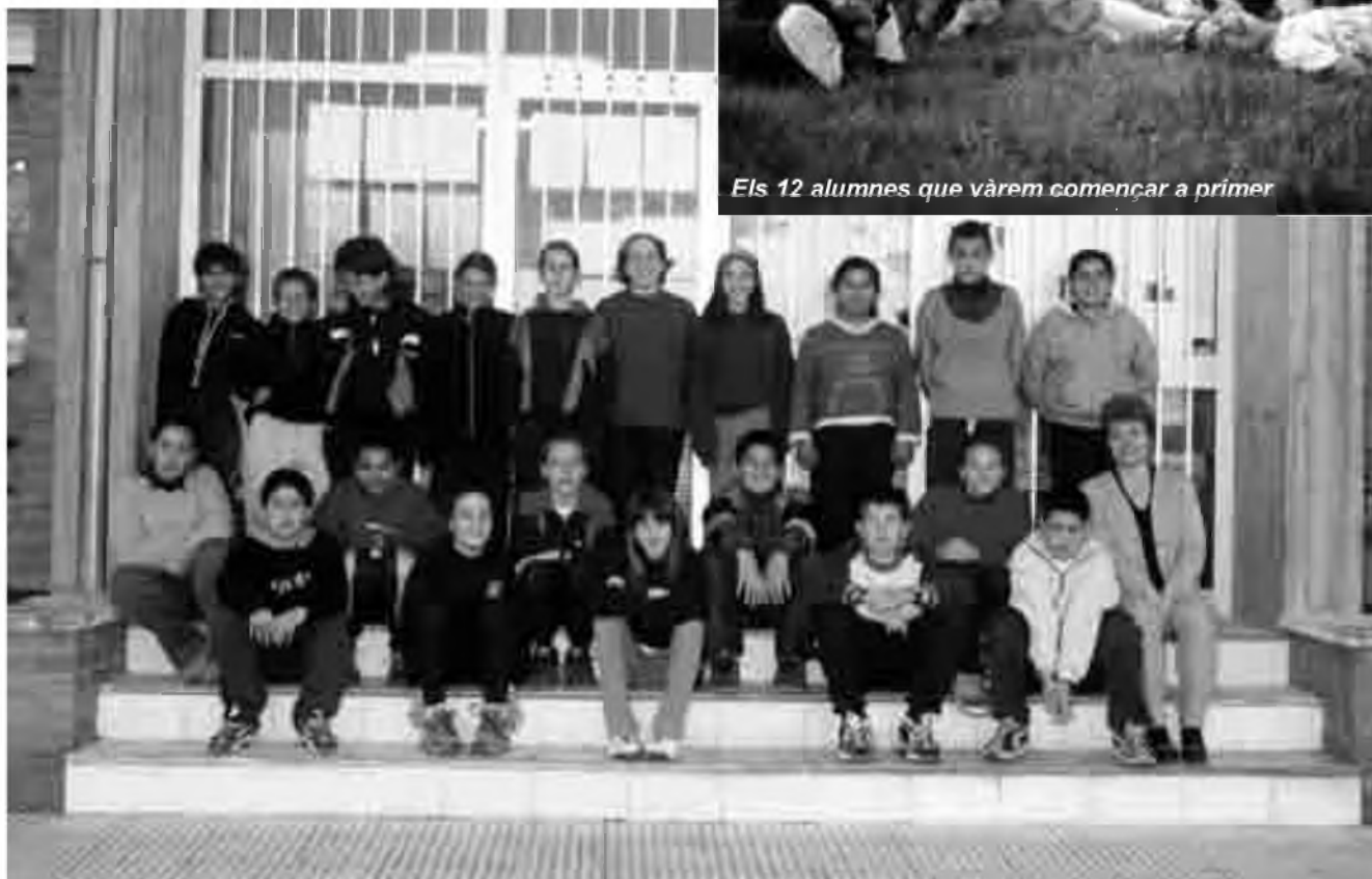
Els 8 nois i 12 noies que hem acabat sisè.