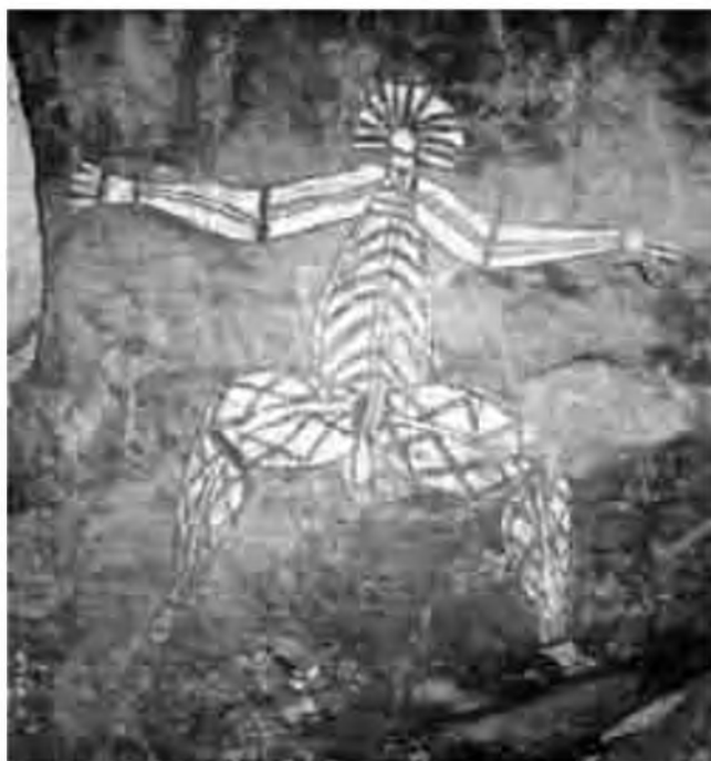
Pintura aborigen que representa el dimoni en una cova del Kakadú.

El mes d'octubre passat vam anar de viatge a Austràlia: és un llarg desplaçament, amb moltes hores d'avió, però realment val la pena, són pràcticament dos dies els que es perden per arribar-hi sortint de Barcelona amb destí cap a Londres, d'aquí cap a Los Angeles i ja cap a Sydney. Aquest recorregut comporta perdre hores d'espera als aeroports i unes 28 hores, aproximadament, tancat en un avió. I quan arribes al lloc, el teu cos nota el brusc canvi d'horari: són unes onze hores més que nosaltres, encara que segons la zona d'Austràlia on et trobes són més o menys.