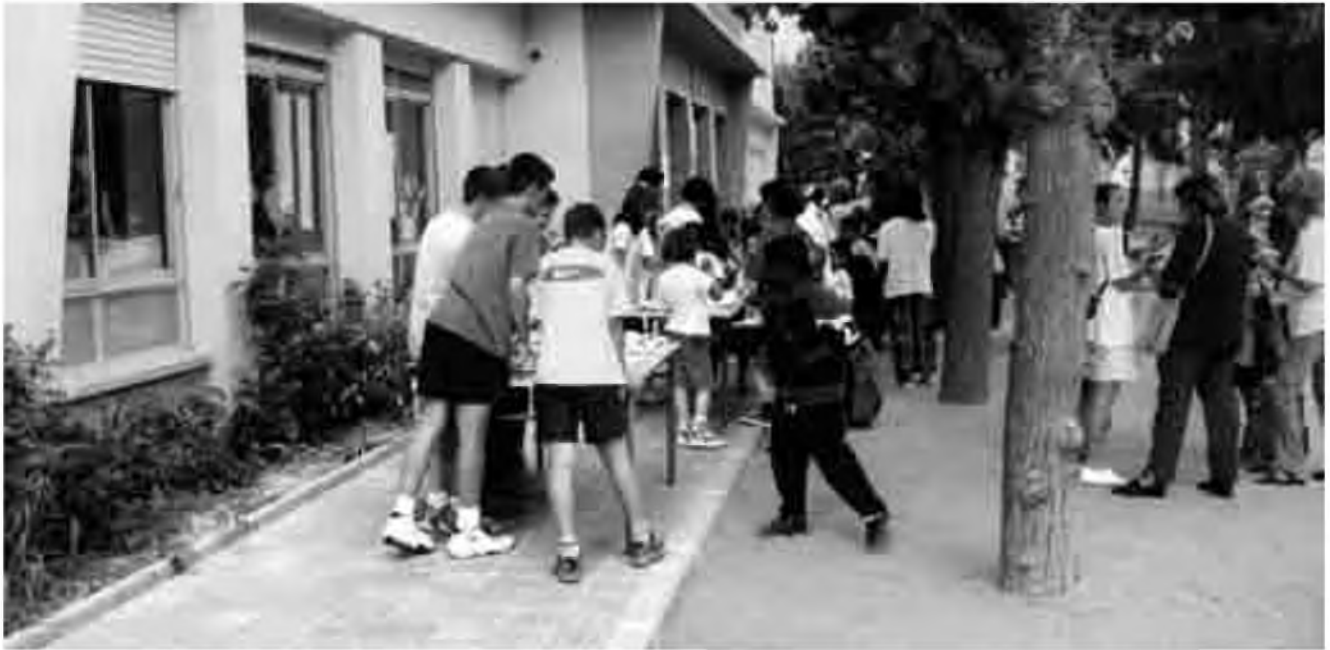
Una de les berenades dolces.