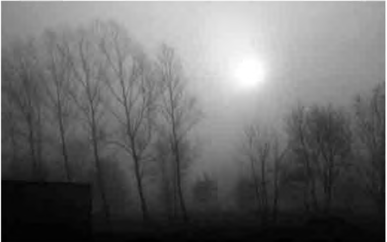
"Boira a l'Institut". (19/12/95). Ir Premi Fotomet 98 (categoria escolar)