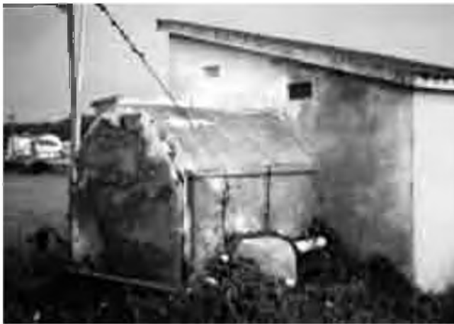
Font del Pla.

Aquesta font, de ben segur, forma part de la història de Vidreres, però malauradament nosaltres no tenim informació ni records personals per fer la interrelació corresponent. Sí que podem dir que fins abans de la portada d'aigua corrent a les cases era molta la gent que n'hi anava a buscar per beure. Diuen que era de molt bona qualitat i fresca. És visible encara la cisterna que emmagatzemava l'aigua i que forma part de la caseta de major entitat que alberga les instal·lacions del pou de captació d'aigües de l'Ajuntament.