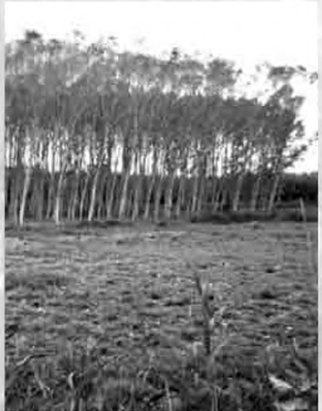
Tram final amb prats de dall.

Un cop el Rec Clar entra al nucli urbà de Vidreres, el canvi de paisatge és radical, l'aspecte és totalment diferent. La vegetació està formada bàsicament per pollancre, a causa del seu interès econòmic. També hi trobem acàcies i plataners. Les espècies herbàcies són les més importants, i arriben a formar bardisses de 2 o 3 metres d'alçada. La romeguera, l'ortiga i la canya són les espècies més abundants, juntament amb alguna liana, arbust o card. Aquestes espècies són oportunistes i, quan un ambient ha patit qualsevol alteració que n'ha fet desaparèixer la seva típica vegetació, ocupen tot l'espai. Al cap del temps, aquestes espècies oportunistes crearan un microambient on es podran desenvolupar les espècies típiques de la zona. Però rarament podem observar mai vegetació típica de ribera en aquesta zona, ja que les contínues estassades fan impossible l'evolució de la successió. Per aquest motiu sempre ens trobem al mateix estadi, on les bardisses són les dominants.