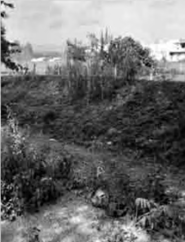
Tram intraurbà després d'una "neteja".

fulles), verd fosc a l'anvers i verd clar al revers. Té arrels per fixar-se i pèls que retenen la humitat. També és abundant la presència de molsa (hi són presents la molsa de pessebre i la molsa d'estrelles). I si ens hi fixem, a l'interior de l'aigua podem veure algues d'aigua dolça, com la Cladophora sp (té un aspecte semblant a cabells de color verd) i Spyrogira (anomenada així perquè vista al microscopi s'hi observa un orgànul helicoidal verd, que és el que li dona color).