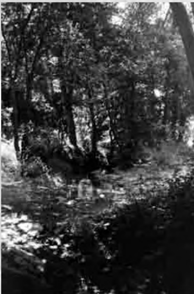
Tram inicial amb paisatge de ribera.

Les bandes de vegetació que trobem al Rec Clar no són uniformes, i sovint són inexistents. Però tot i això hi ha una zona on es conserva una notable varietat d'espècies. Estem parlant del tram inicial, al terme municipal de Caldes de Malavella. Hi podem observar una franja no massa ampla formada per verns ( Alnus glutinosa ), acàcies