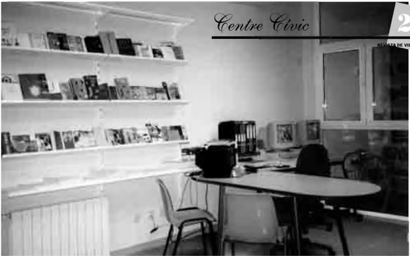
Una de les dependències del PIJ, al Centre Cívic de Vidreres.