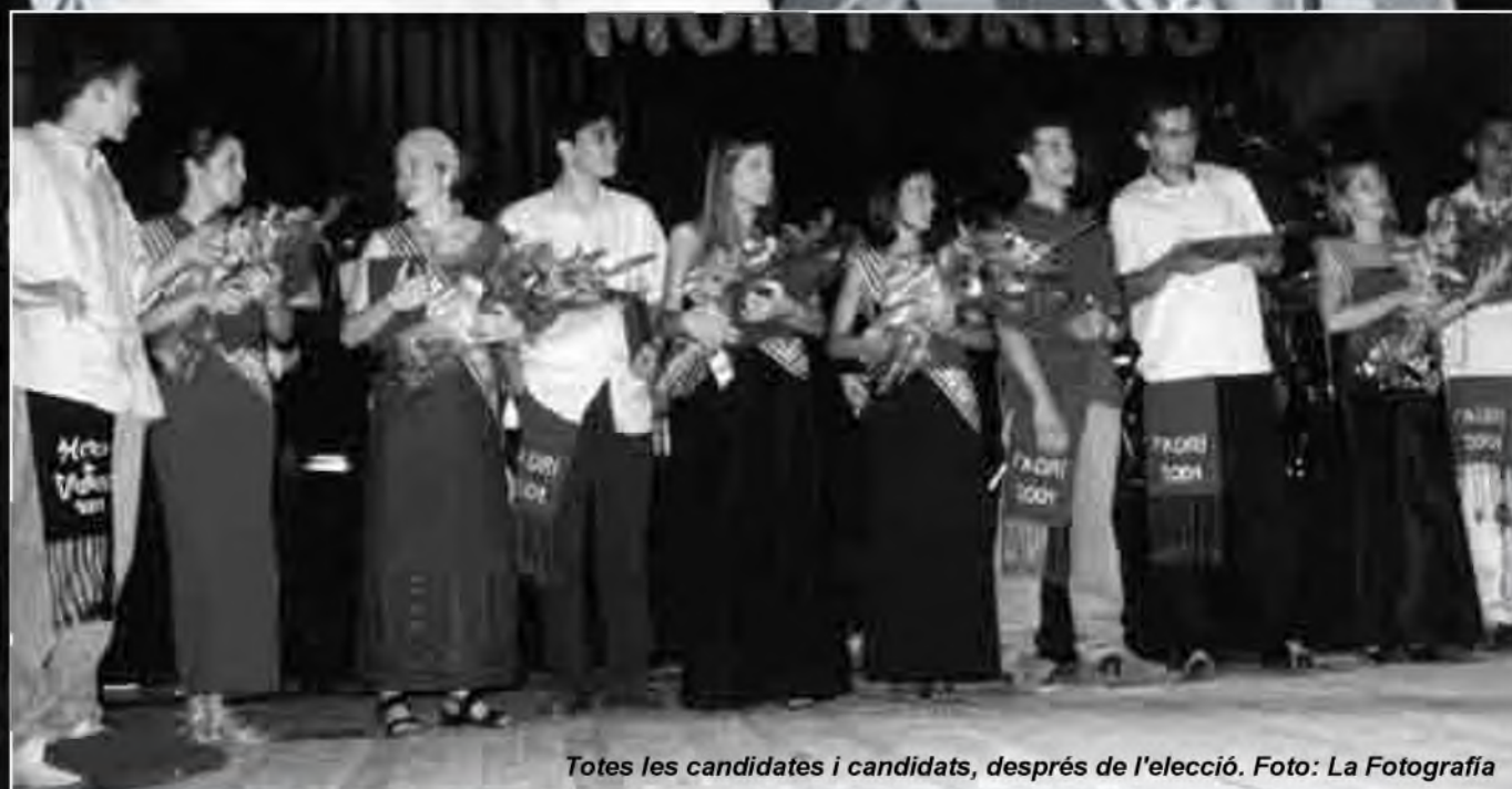
Totes les candidates i candidats, després de l'elecció.