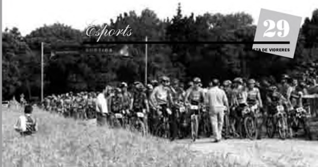
Els participants al Trofeu Caixa de Girona de BTT.