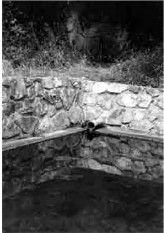
Font de Mas Pedrosa.

Voldríem remarcar la importància de totes aquestes fonts en d'altres temps, en què, a més dels serveis indi-