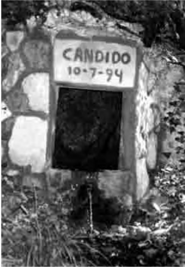
Font d'en Cándido.