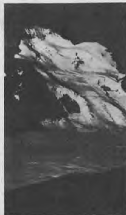
Barre dels Ecrins (4101 m.)