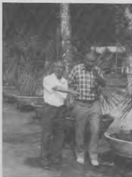
Aquests són els dos valets que han aconseguit la prova.

Un total de 1.974 esglaons, que destigem que es conservin molts anys, i 2.441 arbres centenaris, que desitgem que encara visquin molts anys.