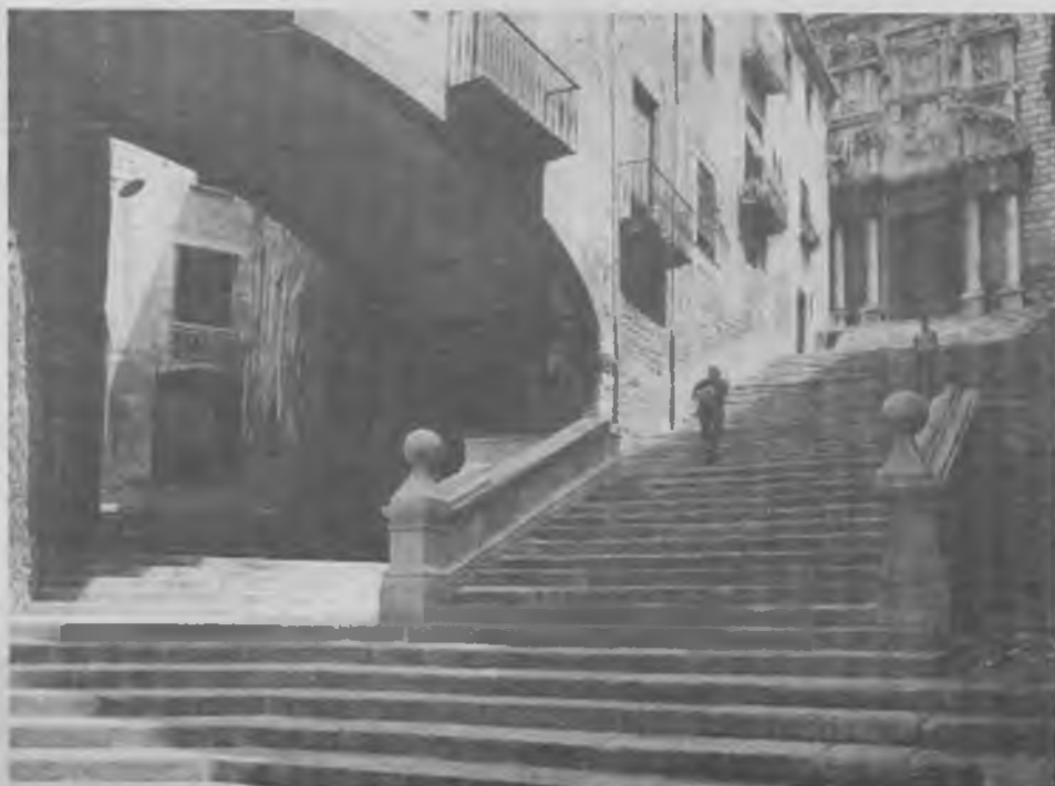
La Girona vella és situada sobre un turó. Per pujar-hi calen escales que salven els desnivells accidentats. Quants graons componen aquestes escales? Segur que ningú no ho sabia. Els nostres jubilats les han comptades.