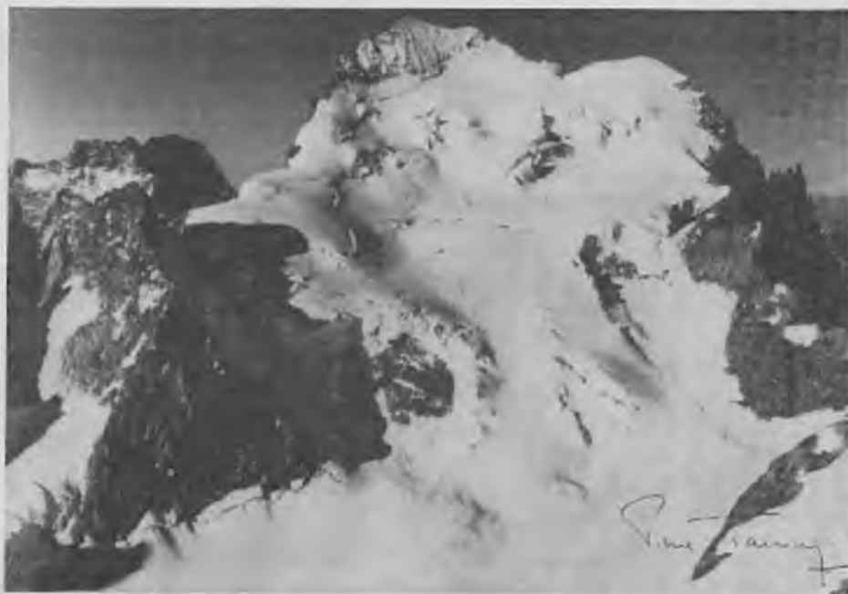
Els Ecrins, un cim de més de 4000 m. conquerit pels excursionistes del C.E.S.

L'anunciada expedició del C.E.S. als Alps ha estat un èxit en tots els aspectes. Una trentena de saltencs vam instal·lar les nostres tendes, el passat mes d'agost, sobre els prats alpins de La Bérarde, voltats de cims altíssims i de neus eternes. En aquell impressionant escenari es va desenvolupar una intensa activitat muntanyenca per part dels nostres excursionistes, que va culminar amb l'assoliment del Dôme de Neige des Ecrins, de 4015 metres d'altitud, objectiu principal de l'expedició.