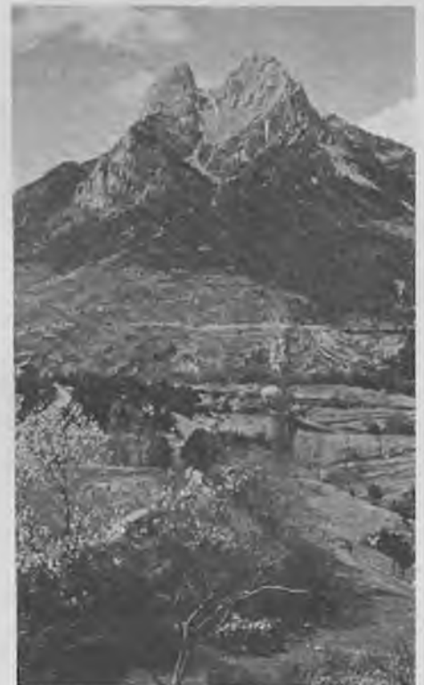
L'impressionant i característic massís del PEDRAFORCA, cobrint per tots els excursionistes i que serà l'objectiu d'una propera excursió del C.E.S.

Per als dies 27, 28 i 29 hi havia anunciada l'excursió al Pedraforca, que va haver-se de suspendre a causa, també del mal temps. Aquesta sortida queda en cartera per a una pròxima ocasió, ja que havia despertat molta expectació entre els nostres socis.