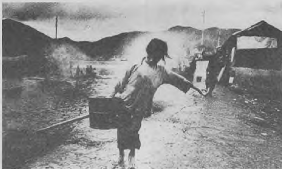
Els infants constitueixen més de la meitat de la població mundial i, tanmateix, pràcticament no tenen ni veu ni vot en l'orientació de llurs vides.

El nostre món és un món pensat per a uns adults-no adults on s'aplau-deix l'èxit a costa d'altres, la competitivitat i on, allò que pot semblar