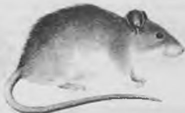
15.— RATA, Rattus rattus .

Cap i cos 15'8 a 23'5 cm. Cua 18'6-25'2 cm. Pesa de 145 a 215 gr. Cua molt llarga, de 200 a 260 anells. Té el morro punxegut, orelles més grosses que la rata treginera, ulls grossos. És de color gris-negre, de costums nocturns i omnívora. Viu associada a l'home i representa una veritable plaga. Està en expansió i la podem trobar a tot Salt, és molt abundant.