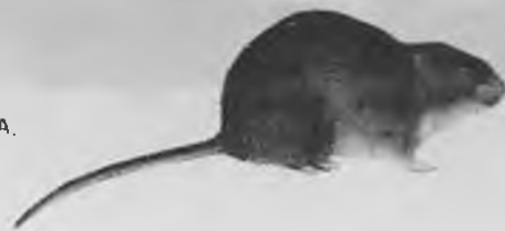
19.— RATA D'AIGUA, Arvicola sapidus L.

Cap i cos 16'2-22 cm. Cua de 9'8 a 14'4 cm. Pesa de 150 a 280 gr. És grossa, de cua llarga i morro punxegut. Viu als rius, basses i rierols. És activa de dia, neda amb facilitat. Construeix els caus a les riberes i és herbívora. A Salt la trobem a les vores dels rius.