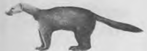
5. — FAGINA Martes foina (ERXLEBEN)

Cap i cos de 42 a 48 cm., cua de 23-25 cm., pesa d'1 a 2'3 kg. Porta una taca blanca a la gorja, morro clar, la resta del cos de color marró fosc. Té les orelles petites i estretes. Viu als marges i zones pedregoses cobertes de bardisses. A Salt la podem trobar a les Deveses. És carnívora, de costums nocturns, camina fent salts i s'enfua bé als arbres. Niu als socs vells, estables i graners, munts de pedres, etc.