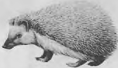
1. — ERICO. Erinaceus europaeus L.

Amida de 22'5 a 27'5 cm. de llargada. Pes de 450 a 1200 gr. Cos massís i pesat. Morro punxegut. Orelles petites i rodones. Cap i parts inferiors del cos recobertes de pèl. Les parts superiors amb espines. Surt al capvespre i és actiu de nits. En cas de perill s'enrotlla en forma de bola (reflex que li és molt perjudicial actualment ja que el gran destructor d'ericons és l'automòbil que els aixafa quan estan enrotllats al mig de les carreteres). Hiverna. Fa els nius amb molsa, herbes i fulles. És insectívor. A Salt el podem trobar a tot el Pla, més als camps que a les Deveses, arriba a introduir-se a les cases. Molt comú.