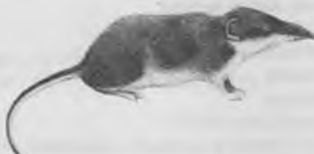
3. — MUSARANYA VULGAR. Crocidura russula (HERMANN)

Cap i cos de 6'4 a 9'5 cm. Cua de 3'3 a 4'6 cm. Pesa de 6 a 14 gr. Orelles i morro allargades cap al davant, i