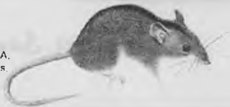
14.— RATOLI BOSCA, Apodemus sylvaticus .

Cap i cos 7'7-11 cm., cua 6'9-11'5 cm. Pesa de 14 a 28 gr. Color marró clar a sobre i blanc-gris a sota. Té les potes i orelles llargues, la cua de 120 a 190 anells. És nocturn i omnívor. Cava galeries i no defuig les cases ni les construccions humanes. Els trobarem a tot Salt.