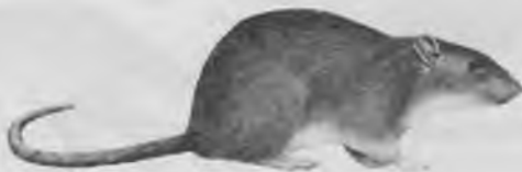
16.— RATA TRAGINERA o RATA DE CLAVEGUERA. Rattus norvegicus . (BERKENHOUT).

Cap i cos 21'4-27'3 cm., cua 17'2-22'9 cm. Pesa de 275 a 520 gr. És grossa i robusta té la cua més curta que la rata, és de color gris, nocturna i omnívora. Viu associada i depen totalment de l'home, és cosmopolita, originària de l'Àssia i introduïda a Europa el segle XVIII. Està en una etapa d'expansió i comporta un greu problema sanitari a les ciutats. La podem trobar a tot Salt.