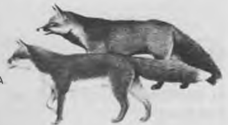
4. — GUINEU o GUILLA Vulpes vulpes (L).

Cap i cos de 58 a 77 cm., cua de 32-48 cm. Pesa de 6 a 10 kg. Color variable (generalment marró-vermellós), sempre, però, el final de la cua és de color blanc. Orelles llargues i punxegudes, cua grossa i llarga, molt peluda. Els mascles tenen una glàndula que produeix una flaire molt característica (encara avui dia molts bosquetans són capaços de seguir el rastre d'una guilla per l'olor). Té costums nocturns, no obstant, també se'n veuen de dia. Cava uns caus amb moltes sortides. És carnívora. Ha estat molt perseguida i al Pla pràcticament ha desaparegut, podria ser, però, que en quedés algun exemplar a les Deveses.