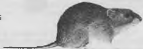
20.— TALPÓ ROIG Clethrionomys glareolus ISCHRENERI

Cap i cos de 8'1 a 12'3 cm. Cua de 3'6 a 7'2 cm. Pes 14'5-36 gr. Color vermellós acompanyat de gris als cantons, orelles visibles. De dies surt a la superfície de terra, fa galeries. És una espècie típicament europea, viu lligada als llocs humits. Hi ha una cita a les vores de la Riera de Mus (Heramús).