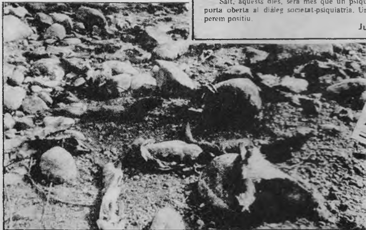
Els peixos apareixen a les vores i les rates els consumeixen ràpidament

Però pel que vam poder observar, els nostres Consellers es van mostrar molt poc convençuts que cap d'aquests alts organismes ens hagin de solucionar res.