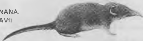
2. — MUSARANYA NANA. Suncus etruscus (SAVI).

Cap i cos de 3'6 a 5'2 cm., la cua de 2'4 a 2'9 cm. Pesa de 1'5 a 2 gr. És el mamífer més petit que es coneix. Té uns pèls llargs per sobre dels normals. Orelles grosses. Dents blanques. Per sobre és de colors bru-vermellós i per sota gris. Viu als camps i zones pedregoses de tot el Pla. Fa els nius entre les arrels dels arbres o forats. És insectívora.