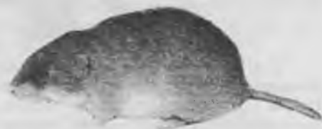
21.— TALPÓ VULGAR Pitymys duodecimcostatus (DE SÉLYS LINGCHAMPSI).

Cap i cos 9'3-10'7 cm. Cua 2'2-9 cm. Molt petit. És de color variable, més o menys vermellós, parts inferiors de colors gris. Viu als camps, excava galeries molt complicades. És el responsable dels pilons de terra que hi ha als camps i que, normalment, s'atribueixen als talps. El trobem a tot el Pla, sobretot en terrenys argilosos.