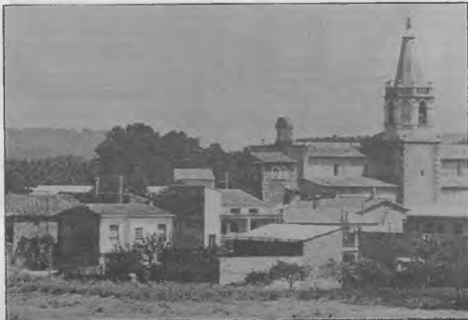
Salt, quan encara era poble