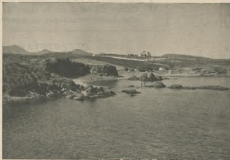
Extraordinaria placidez y gracia la de La Farella.