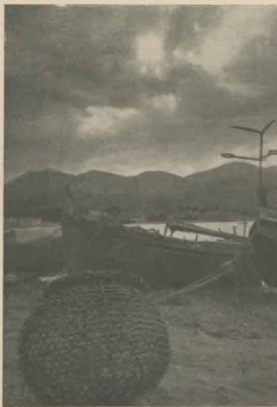
El Puerto con su agobio de embarcaciones, jarcias, nubes y montañas. Y sin embargo, ¡qué bello!

Una de las de más importancia: la independencia