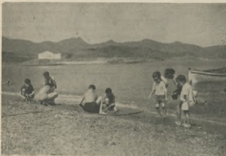
Reposo que no les resulta insulso.

b) Por sus aguas limpiísimas y clima seco y sano.