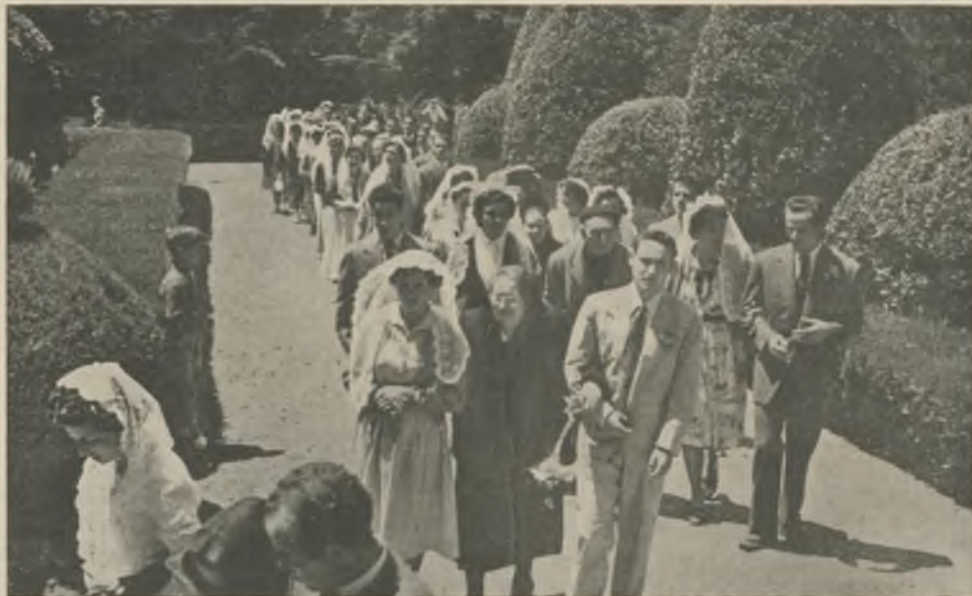
Un bello recuerdo de la Fiesta de Homenaje a la Vejez celebrada en 1953. Como anunciamos en otro lugar de este mismo número, en 1956 tendremos ocasión de rendir a nuestros ancianos el tributo de nuestra admiración. Las impresiones que tenemos de la reunión del Patronato Local son harto halagüeñas.

OTRA BUENA ACTUACIÓN. —Los Juveniles empatan en Port-Bou en partido amistoso de fútbol. Parece que van mejorando. Esperamos verles en nuestro Campo en fechas venideras para constatar sus progresos durante estos meses.