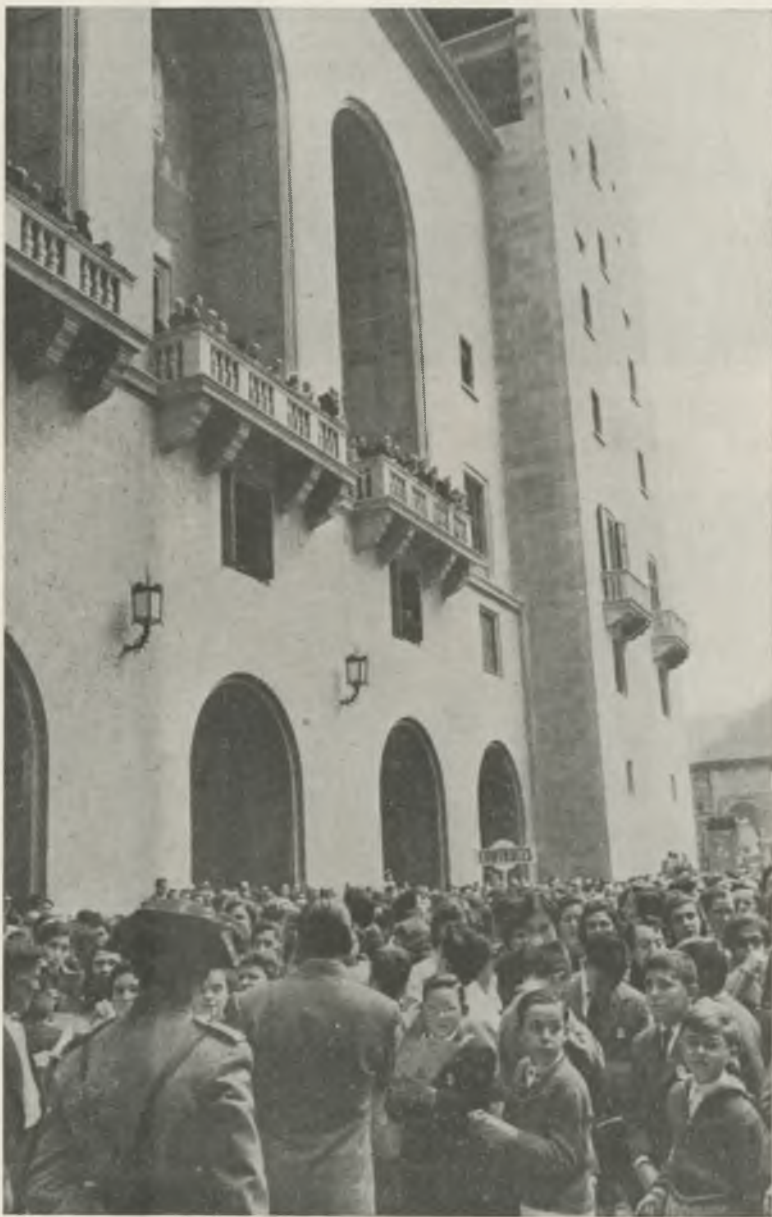
14 de Noviembre. «Aplec» de orfeones a Montserrat. Aspecto de la fachada del Monasterio, mientras se prepara el Concierto.

Fué en el mismo año de 1888 que el maestro Millet tuvo ocasión de oír las masas corales extranjeras que concurrieron en los certámenes musicales que con motivo del citado certamen se celebraron, y se dió cuenta de como pueden ejecutarse las obras de los grandes compositores si los cantores saben música y si a las voces del hombre se añaden las deli-