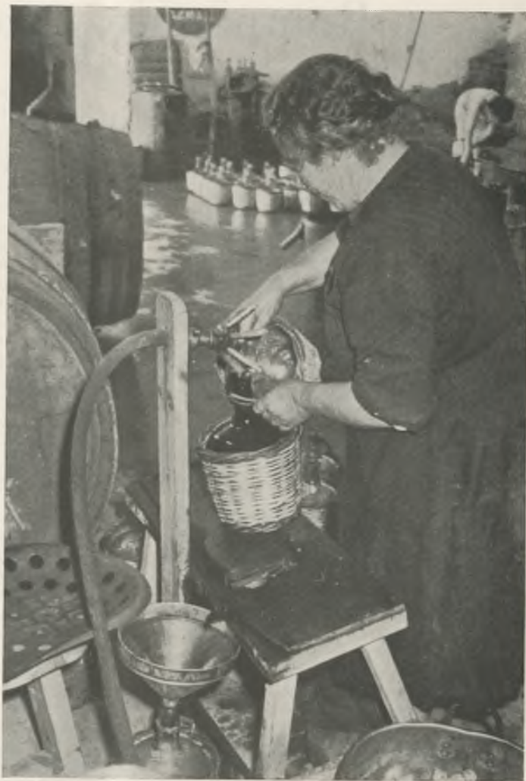
Casa Coll. Embotellando primorosamente el vino que va a la exportación.

No por ello es sensato desmerecer en lo más mínimo los vinos que alaba nuestro escritor, que tienen fama muy bien cimentada y que debemos admitir como los preferidos y probablemente como los mejores para la mesa. Pero habiendo observado, incluso a alemanes y franceses, tomar vino común del nuestro, mal elaborado, y que lo preferían a los vinos suaves y de técnica depurada, y conociendo quienes se han levantado en mal estado de la mesa después de beber vino de baja graduación y los muchos que lo hacen en sus cabales habiéndolo bebido del nuestro y asimismo sabiendo que no podemos descartar la gente que gusta de tomar poco vino pero fuerte, es innegable que hay que admitir que el vino de 12 a 15 grados tiene sus partidarios y también que éstos algún día pueden ser más numerosos que ahora. Claro que ello podrá suceder cuidando bien la elaboración (el Sr. Serradell aconseja vendimiar por San Miguel), repugnando completamente la adulteración de nuestro producto y sobre todo reduciendo la regla que nos da José Pla de beber un litro de vino y