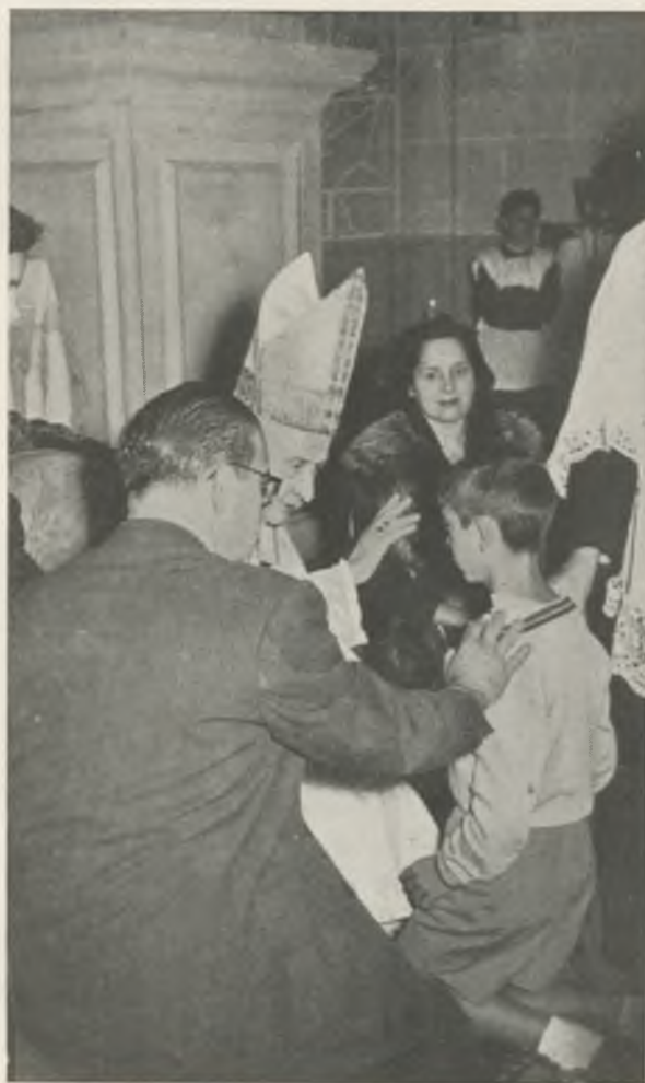
Un momento de la administración del Sacramento de la Confirmación.

Dios le dé un buen acierto en su cometido.