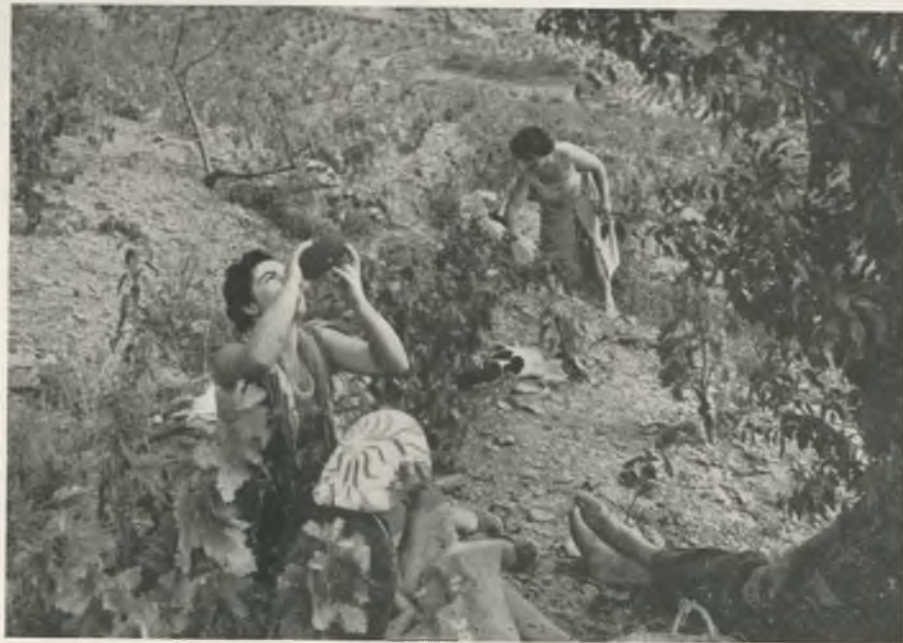
Descanso en la vendimia.