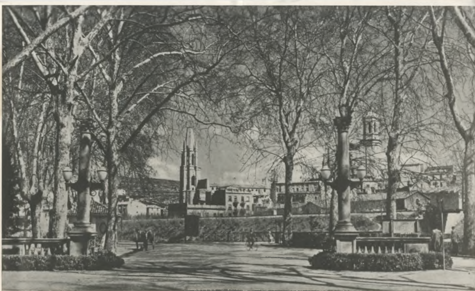
Desde la Dehesa, los característicos campanarios de Gerona se destacan serenamente.