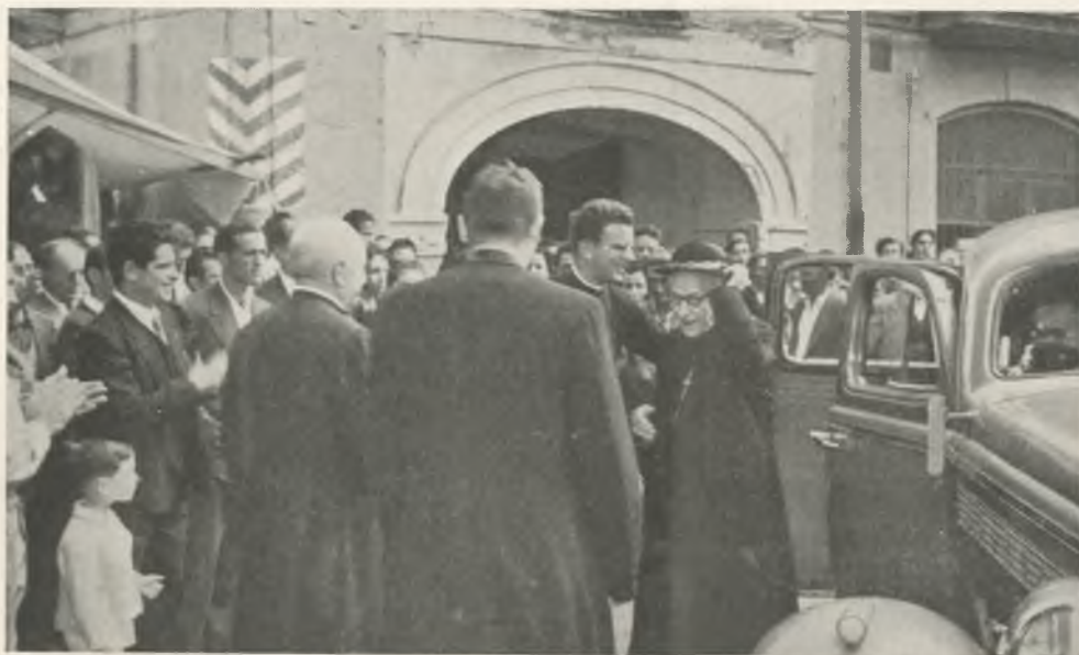
Llegada de S. E. el Obispo de Gerona para celebrar la Santa Visita Pastoral.