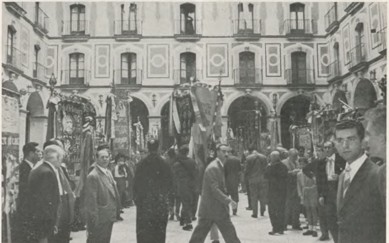
Este bello proliferar de «senyeres» delante de la Basílica daba una impresión de emocionada alegría a todos los asistentes