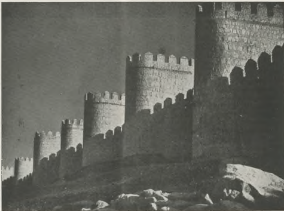
Murallas de Ávila

CURSOS POPULARES. —Se ha iniciado el segundo curso popular, organizado por el Centro Cultural, de clases de inglés y francés.