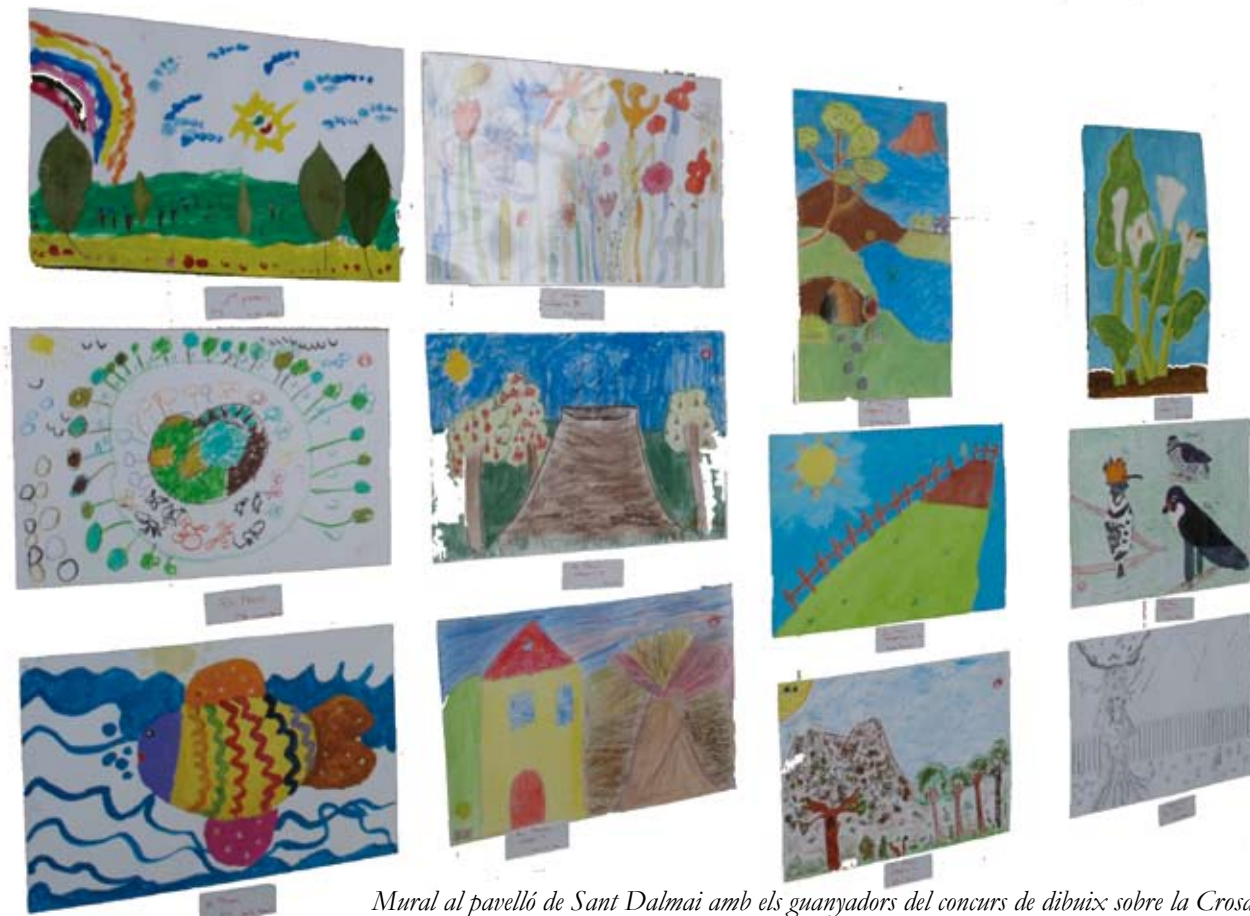
Mural al pavelló de Sant Dalmau amb els guanyadors del concurs de dibuix sobre la Crosa

Organitzada per la Comissió de Festes d'Estanyol, amb la col·laboració del Consorci de la Crosa i amb el suport dels ajuntaments d'Aiguaviva, Bescanó i Vilobí d'Onyar i la Diputació de Girona, va tenir lloc, diumenge 24 de maig, a l'àrea de les Guillotes (GI-533, Km 9,4, entre Estanyol i Sant Dalmau) la setena edició de la Festa del volcà de la Crosa. Segons l'opinió general dels promotors de la iniciativa, en aquesta ocasió hi va haver més gent que mai. L'oferta per al públic assistent era d'allò més variada: rutes en BTT i caminades guiades pel volcà per a petits i grans; parades d'artesans i productes naturals; inflables; jocs de cucanya; passejades en poni; tir amb arc... També hi va haver servei de bar durant tot el dia i dinar popular.