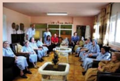
Dins el marc de la festa d'homenatge a la vellesa, el dimecres dia 10 de juny una representació del Consistori municipal va visitar la Fraternitat de Santa Clara de Vilobí d'Onyar, on hi resideixen 15 germanes, la majoria de les quals amb més de 65 anys d'edat.