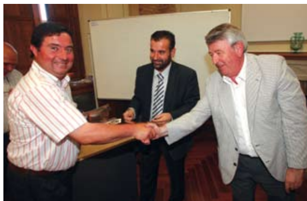
Tercer premi per al Blat de Moro Ensitjat, al Mas Bes

Pel que fa al Premi Qualitat de la Llet, el Primer Premi va ser per a Cal Carreter; i pel que fa al Premi Blat de Moro Ensitjat (farratge d'estiu), el Tercer Premi va ser per al Mas Bes.