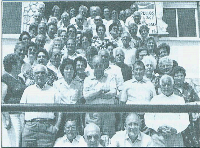
Una excursió a la costa