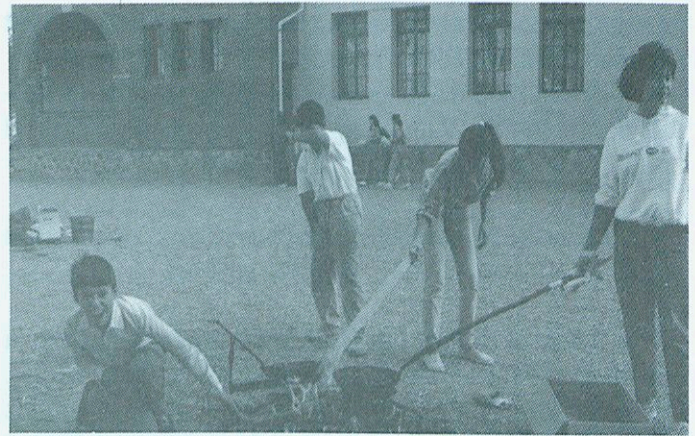
La castanyada a l'escola.