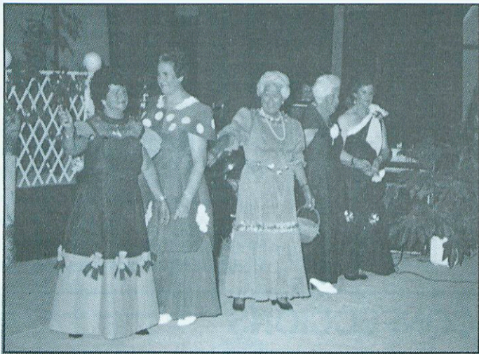
Desfilada provincial a Figueres