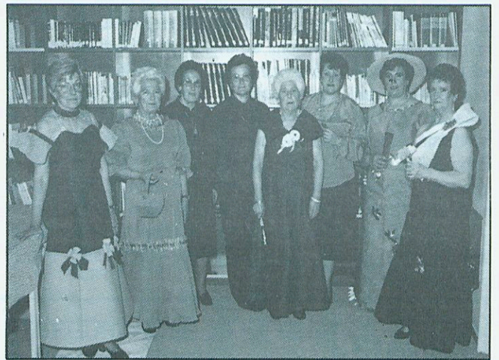
Desfilada festa d'aniversari del Casal.