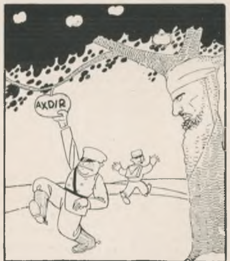
"Encara són verdes," caricatura d'Abril-Lamarque, a "El Diario de Cuba," de Santiago, 23 novembre.