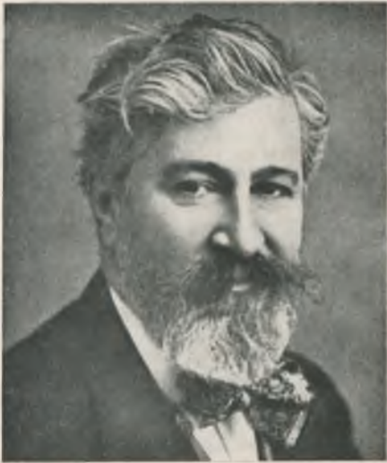
L'il·lustre pintor i escriptor Santiago Russinyol

Catalunya, a iniciativa d'En Josp Maria de Sagarra, ha posat una corona de llor damunt la venerable testa blanca de Santiago Russinyol. L'acte es realitzà en els inicis de l'any que corre, el dia 10 de gener, a Sitges, dins el Cau Ferrat, museu d'antiquitats bastit sota la direcció i munificència de l'homenatjat.