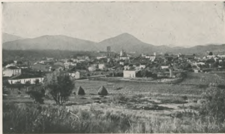
Vista general de Breda. Al fons el turó de Montsoliu.