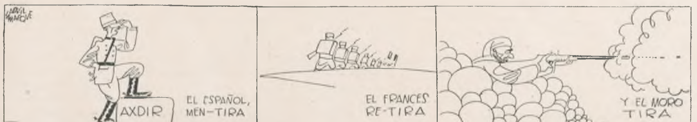
«UNA TIRA DE TIROS». — Caricatures del dibuixant cubà Abril-Lamarque, publicades a «El Diario de Cuba», de Santiago, 23 novembre, 1925.