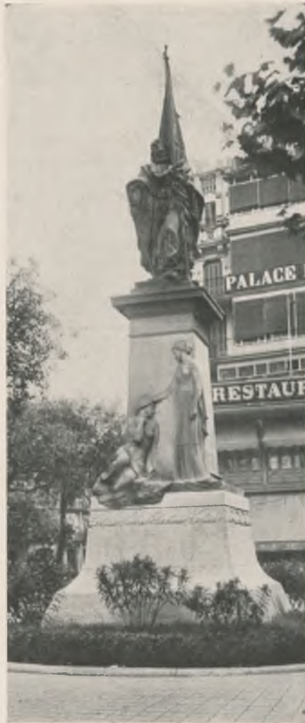
Estàtua de Rafael Casanova al lloc on caigué ferit.

... i un altre any ha passat sense que hàgim vindicat l'heroica gesta dels màrtirs