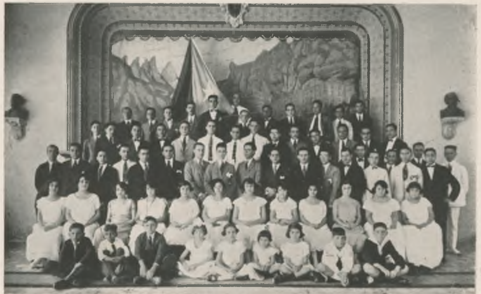
Les tres seccions que integren l'Orfeó Catalunyà de Santiago de Cuba.