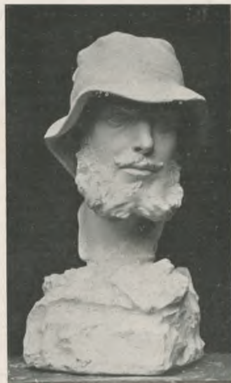
L'AVENTURER, obra de D. Civit.

Catalunya. Fou una bella consagració, una consagració justa, val a dir.