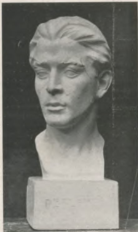
REFLEXIÓ, testa, per D. Civit.

Rafel Benet, a "La Veu de Catalunya", s'expressà així: