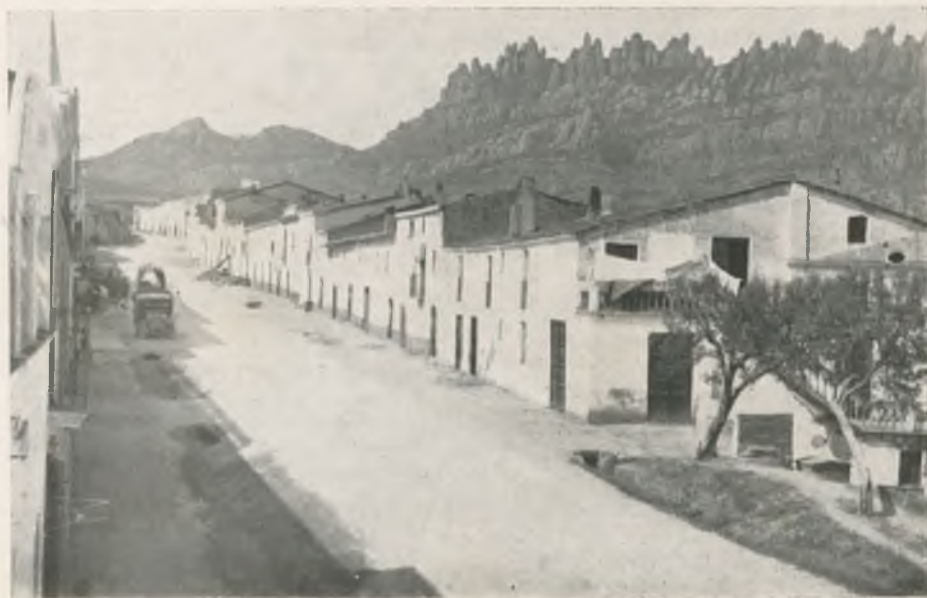
BRUC DEL MIG. — Detall de la població.