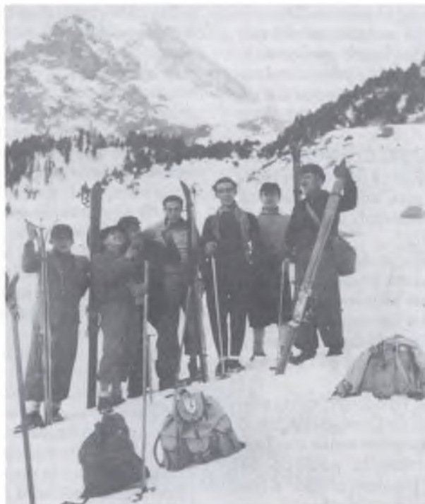
Camí d'Ull de Ter. Abril 1949

Actualment, en general, ja és molt difícil. Carreteres i pistes que facilitarien l'accés als antics caminants, són vies d'apropament a rancs verges de les muntanyes on, la majoria, si no fos la moto o el jeep, no hi haurien pujat mai a peu i que tota la seva il·lusió és el poder comprovar l'eficàcia i la potència del motor del seu vehicle.