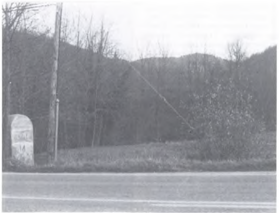
Lloc de sortida del Túnel de Bianya al K. 14

— En la carretera que va de Barcelona a Ripoll —ja que des de Ripoll a Puigcerdà és del MOPU—, en aquest moment estem acabant el tram d'Autovia fins passat Centelles i anem a licitar el tram fins a Centelles-Tona i Tona-Vic, amb l'idea que d'aquí a l'any 92 arribarem fins a la capital de l'Osona. Simultàniament també aquest any, subhastem ja les obres d'agencament de les curves del Coll de Tarradelles, és a dir, des del límit de la província de Barcelona, fins arribar a Ripoll. Fixi's que ens saltem un tram intermig, que és el de les curves d'Oris, (comarca de l'Osona) que ho arreglarem l'any que bé, però si així ho fem és perquè el Ripollès és comarca de muntanya, i com que aquestes comarques tenen un pla Especial, es va poder lograr a través del mateix pla que es féssin abans aquestes inversions que les que corresponen a la Comarca d'Osona. Per tant, vol dir això que el 92 arribarem fins a Vic, el 94 fins a Ripoll i després, fins a Camprodon i el Coll d'Ares.