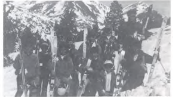
EQUIP DE COMPETICIÓ S.C.C. Temporada 89-90

Neix a Camprodon el 1962, estudia Arquitecte Tècnic a la Universitat Politècnica de Girona, on viu i treballa actualment. Forma part de l'equip gestor del S.C.C. —sots president—.