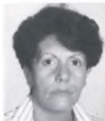
per Carme Alvarez