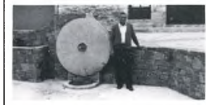
crònica de miquel perals

— Amb data 11 de juliol d'enguany, la Junta d'Aigües, de la Generalitat de Catalunya ha informat DESFAVORABLEMENT la continuació de les obres del Salt de Morens, que pretenia construir HEDATSA. Una altra batalla guanyada. I... dos rius més salvats.