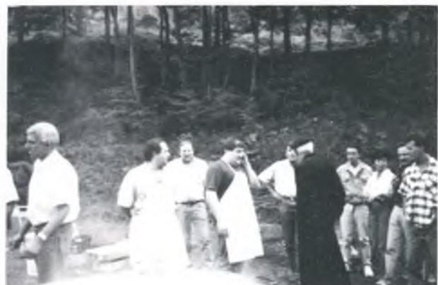
DOS INSTANTÀNIES DE L'ARROSSADA PER A UNES 350 PERSONES QUE ES VA FER AL INDRET DEL CAMP DE TIR.