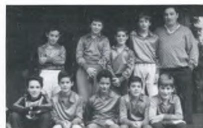
ELS PINETS DE ST. PAU

A darrera hora ens assabentem que l'equip de futbol-sala infantil, que l'any passat ho va guanyar tot continuarà jugant gràcies —fonamentalment— a