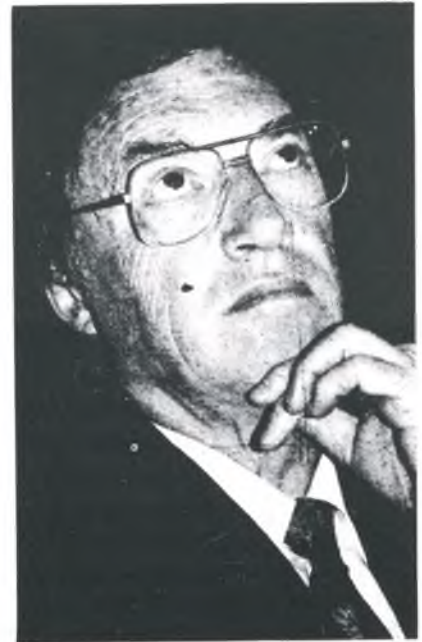
El ministre de Cultura, Jordi Solé Tura

Quina diferència amb el lúcid plantejament d'en Josep Ma. Espinàs al comentar el Pavelló Espanyol a la fira del llibre de Franckfurt, o amb l'honesta fermesa de l'alcalde de Girona Joaquim Nadal, però és clar, aquests no aspiren a càrrec a Madrid , ni a sortir gaire per les pàgines d'El País.