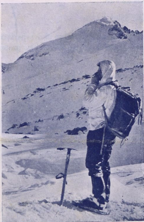
— ADMIRANT EL PIRINEU —