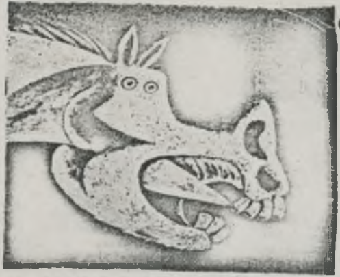
PICASSO - Monstre (Guernica)

précède la sobriété matérielle d'Arquer, la facilité de Cadinanos l'expressionnisme malhabile de Soteras, Campon a des