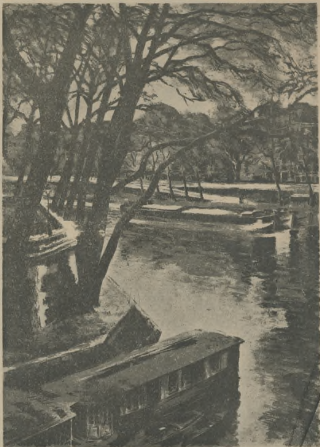
París: Estampa de l'illustrador i pintor Català Carles Fontseré.