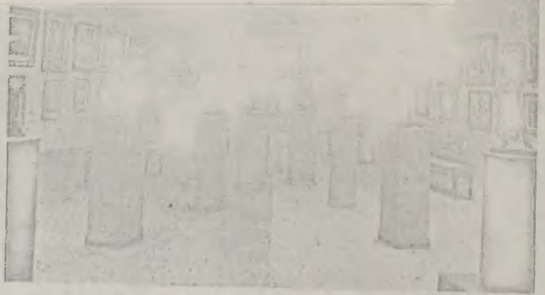
Exposition d'Art Espagnol - Galerie La Boétie

En escultura, bellisimas obras de Manolo, Pié, Madrideojos, Blanca, Alos, Monesma, Valiente, Pascual, Menendez y Condoy. Se destacan por su originalidad tres esculturas en madera de Cla-