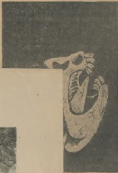
« (Picaso). »