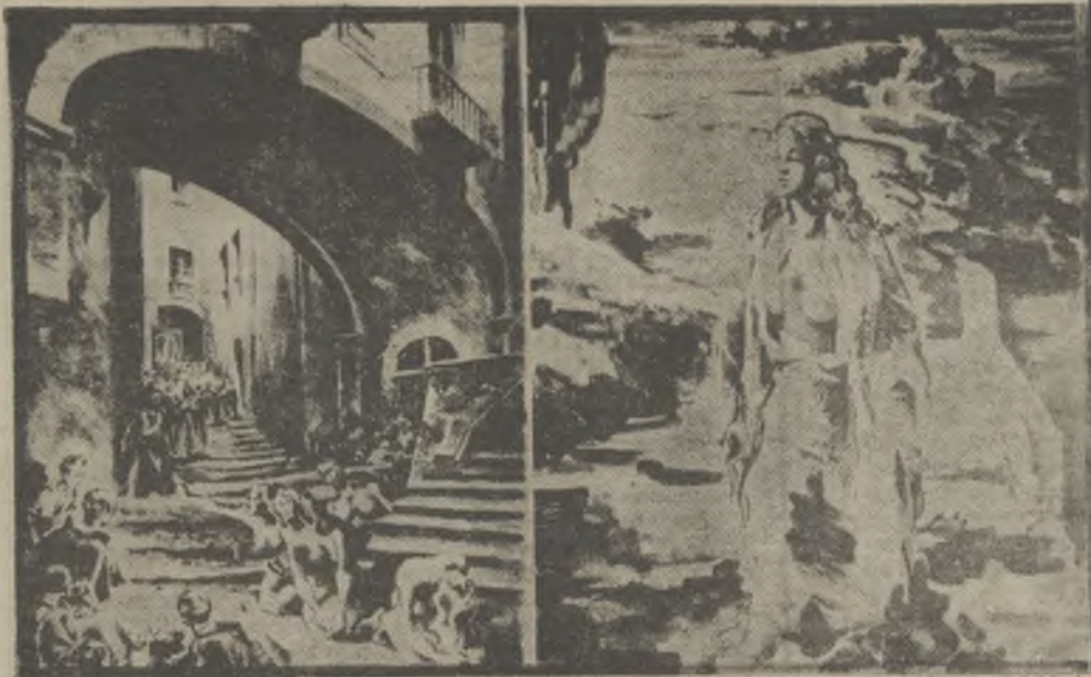
• Dos ilustraciones de Fontseré; «Fi del món a Girona», libro de Ruyra; y el «Romancero gitano»