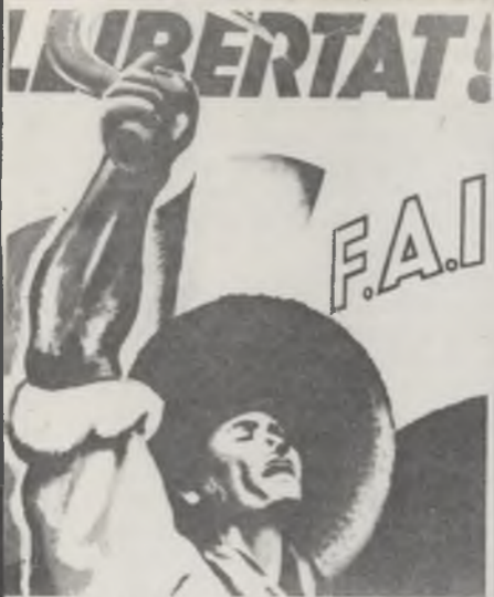
Fontserè: cartells de guerra.