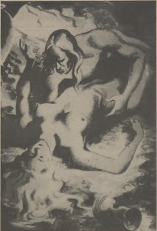
Tres etapas bien definidas de la obra de Fontseré: un cartel de los años de guerra; Dos companys, fechada en el 40, y Allí me enseñó ciencia muy sabrosa, litografía inspirada en el Cántico Espiritual, de San Juan de la Cruz, sobre 1944.