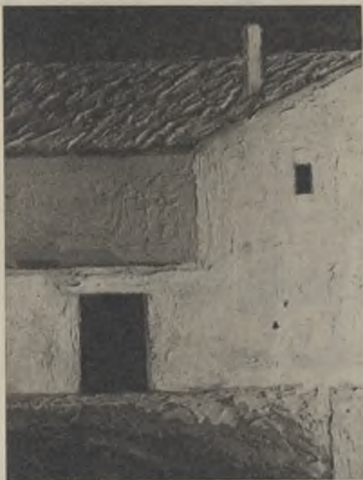
Fontseré. — "Portal de l'eixida"

En Syra expone un centenar de litografías y aguafuertes, pruebas de artista, pertenecientes a una docena de libros de bibliófilo, estampadas a mano por el propio artista. También se exhiben unos cuarenta dibujos que fueron apuntes del natural y composiciones para esas ilustraciones. Ni que decir tiene que cualquiera de los grabados o litografías acreditan a su autor como un ilustrador extraordinario, de exquisito buen gusto.