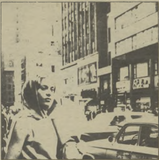
Fontserè exhibe sus fotos en L'Hospitalet