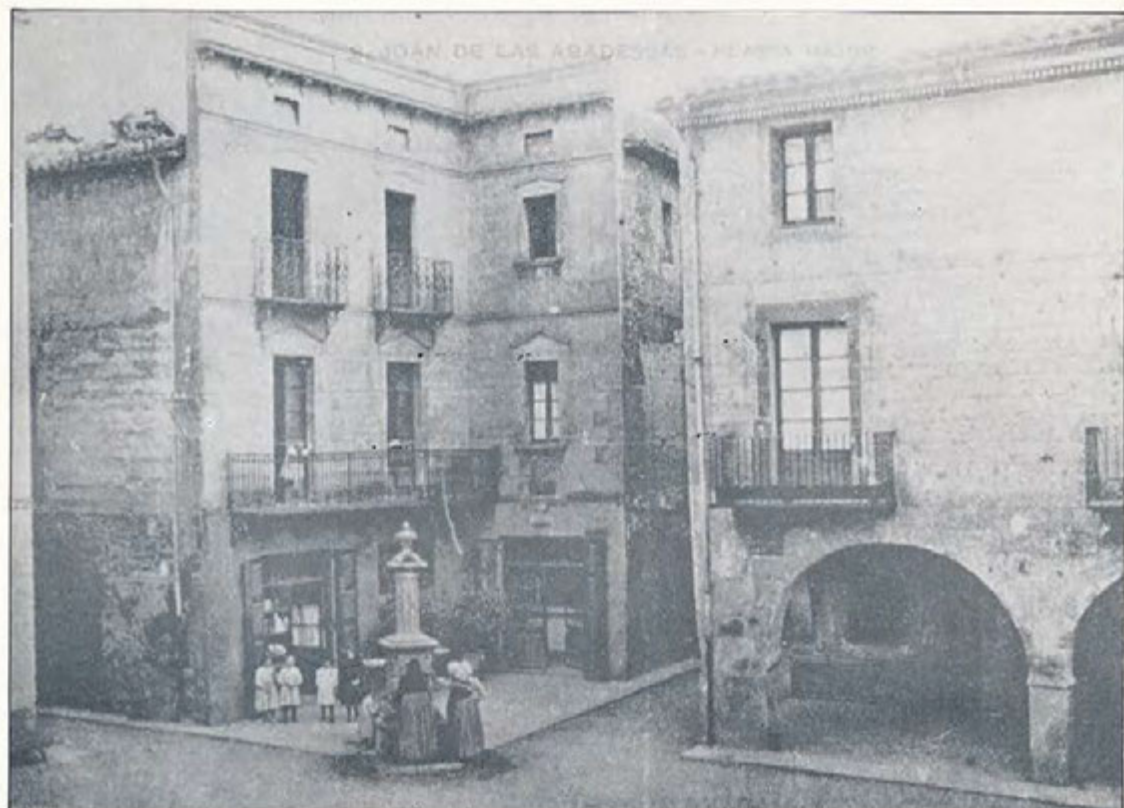
Casa de l'estanc de la plaça Major.

nomenament, deia: «Regularment, els concursos serveixen per a col·locar en els càrrecs persones amb molts títols i migrades aptituds; però, en el cas present, tinc la satisfacció de participar-los que els deixem un Mestre Director competent i sobradament apte per al compliment de la tasca que se li confia, i en aquests moments, un dels músics joves més coneixedors de la tècnica musical, a la vegada que un inspirat compositor».