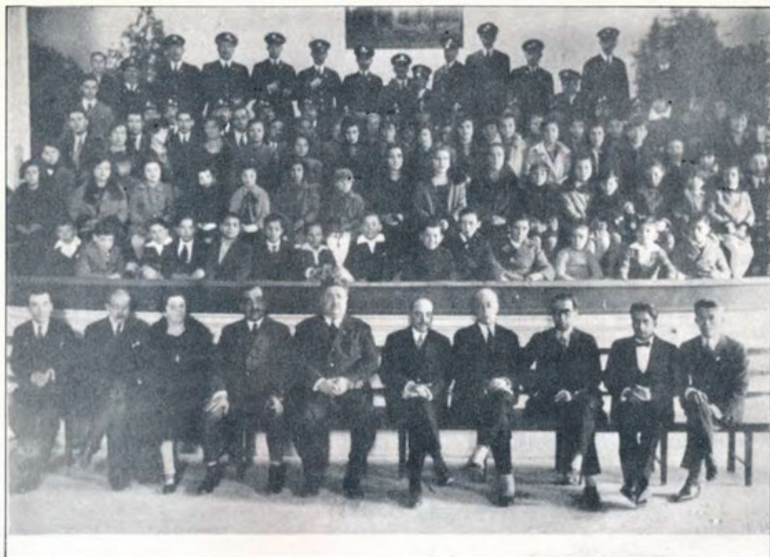
Director de l'Escola Municipal de Música de Terrassa.