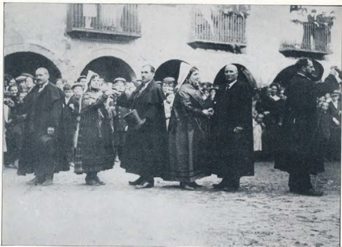
El Ball dels Pabordes abans de la restauració.

Festa Major de l'any 1944, un article glossa els fets més remarcables de la seva vida i, en el transcurs de la Festa, se li va retre el dit homenatge, al qual ell col·laborà tot estrenant tres sardanes de títols prou significatius: «Cercant Promès», «La Plaça del meu Poble» i «La Mula d'en Perots». Ell, amb la família i la Banda Municipal terrassenca varen assistir-hi. Encara hi ha qui recorda el seu plor d'infant tot veient ballar el seu estimat Ball dels Pabordes, la dansa que tants anys enrera li despertava —són paraules seves— «la febre creadora». Un mes i escaig més tard moria a Terrassa.