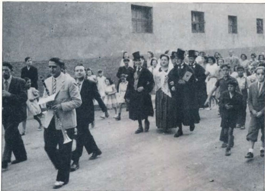
El 1945 Terrassa li oferia un homenatge pòstum. S'interpretà el Ball dels Pabordes.