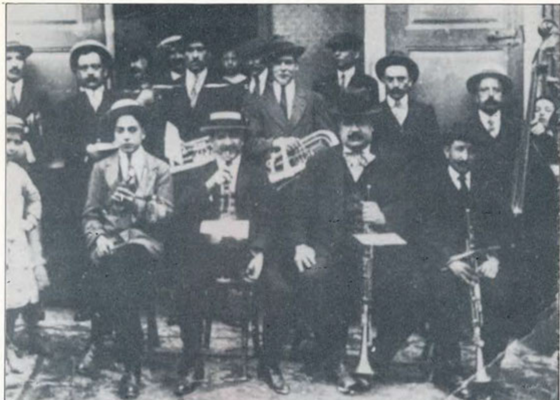
Tocant de primer tenor a la cobla "Els Sendrers"