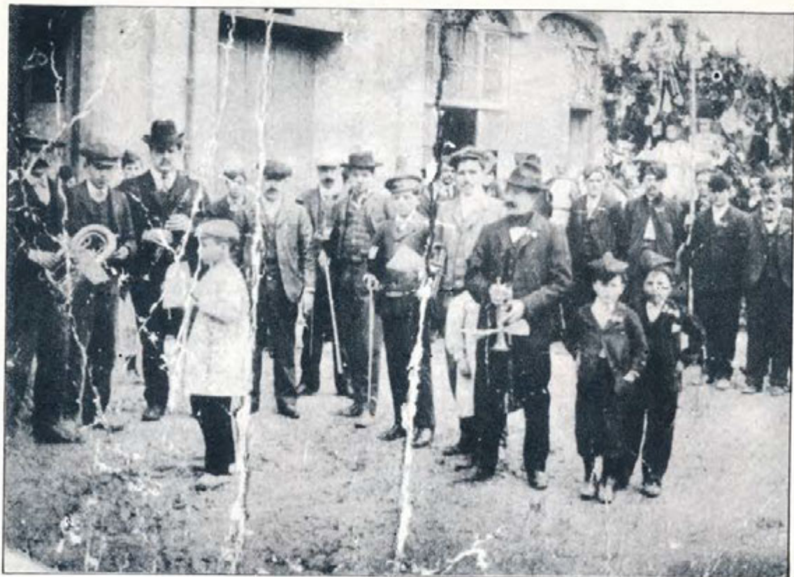
La primera cobla del mestre fou la de la vila nadiua; s'anomenava "La Santjoanina".