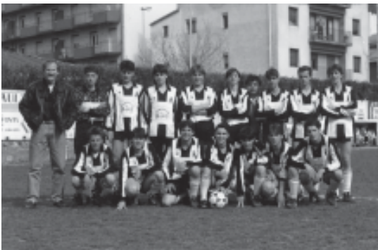
66. Temporada 1991-92. Equip juvenil campió.

La temporada 1987-88 va ser dura i difícil. L'entrenador fou Miquel Forcadell (Foto 64). L'equip es trobà amb una nova categoria molt exigent i d'un gran nivell esportiu (encara no existia la Primera Catalana). Tot i disposar d'una gran plantilla, l'equip no va poder aguantar la Regional Preferent. Com a consol pels santjoanins, es va aconseguir la primera victòria al camp del Ripoll després de 6 derbis consecutius sense conèixer la victòria. A les acaballes de la temporada, es va fitxar algun reforç, com el porter Josep M. a Carrera. L'esforç per salvar la categoria va