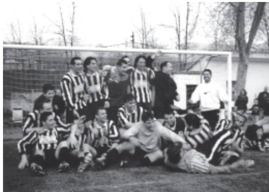
73. Temporada 2003-04. Celebració de l'ascens a Primera Regional.