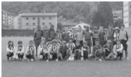
83. Partit amistós dels equips de benjamins del F.C. Barcelona i el C.E. Abadessenc.