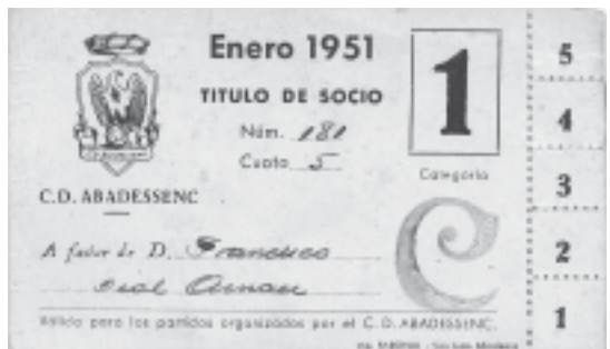
17. Carnet de soci de l'any 1951