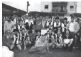
63. Celebració, l'any 1987, de l'ascens a Regional Preferent i foto commemorativa de la jornada històrica.