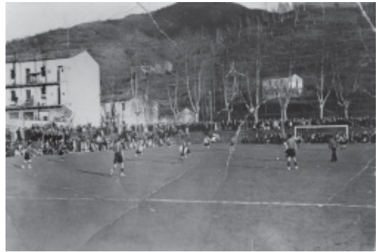
6. Temporada 1933-34. Disputa d'un partit al Manigosta.

En els anys post-guerra, es creen diversos equips de futbol a la nostra vila. En destaquen l'equip de "La Plaça", "La Penya Paperina", "Educación y Descanso", "Acció Catòlica"... (Fotos 9, 10 i 11) Es jugaven molts partits amb altres equips de la comarca. Gràcies a aquests partits, l'afició al futbol anava creixent. És l'època en què els soldats que estaven destacats a la