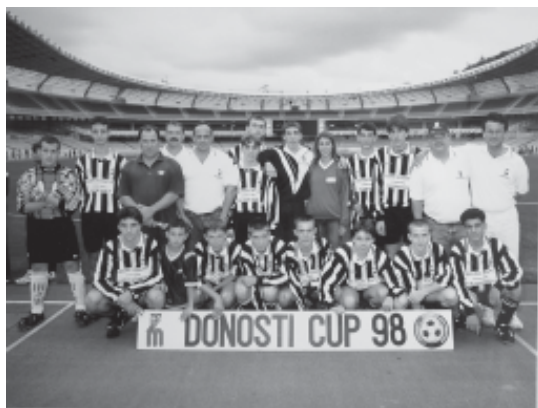
80. Participació del futbol base a la Donosti Cup, l'any 1998.

Com ja ha quedat palès en aquest monogràfic, el Club