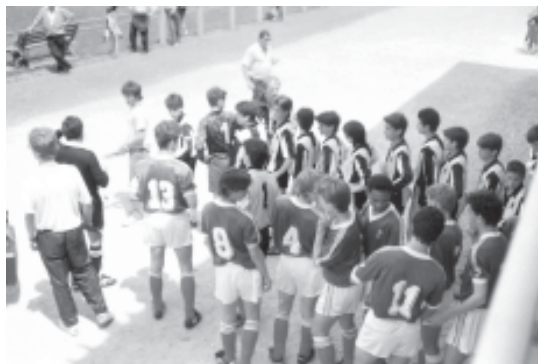
81. Participació del futbol base als torneigs internacionals de Le Palais Sur Vienne.