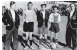
Temporada 1935-36. Kick off d'un partit celebrat l'any 1935.