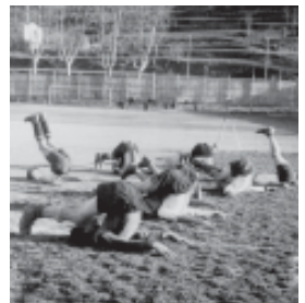
Temporada 1935-36. Entrenaments de pretemporada de l'Abadessenc.