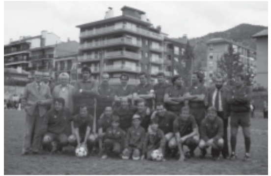
56. 1983. Equip de veterans del Barça que varen disputar el partit del dilluns de Festa Major.