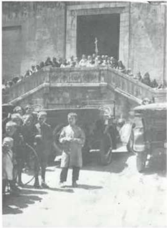
Festivitat de Sant Cristòfor.