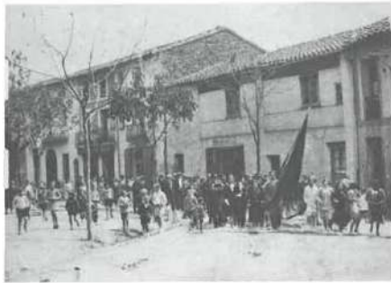
Festivitat de Santa Llúcia.