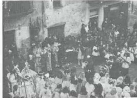
Processó de Corpus.