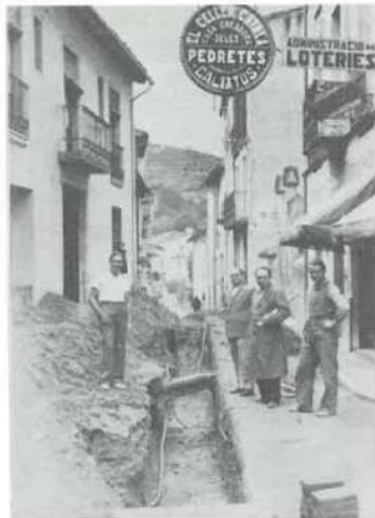
Asfaltat dels carrers.