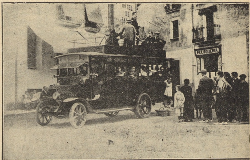
Un dels grans auto-ómnibus que fan el recorregut de Sant Hilari a la Font Picant.

Aviació en las montanyes catalanes. Lliroia no's publicava aleshores. Lliroia desde sa naixença creu estar en deute amb tant trascendental fet, dedicant-li l'atenció merescuda. Es un fet que a la historia de l'Aviació catalana li quedarà sempre més unit el nom de Sant Hilari Sacalm i ens interessa no's desvirtuhin els fets.