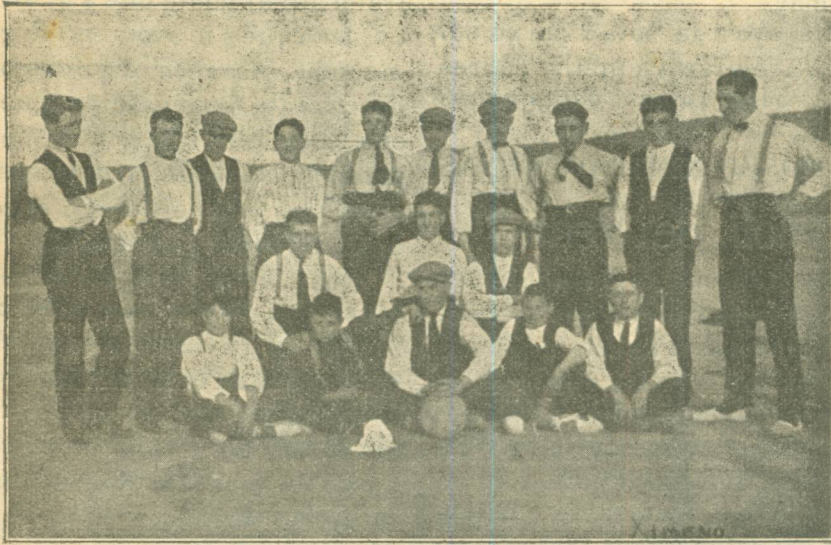
Personal en preparació pel primer equip