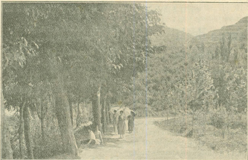
CAMÍ DE LA FONT D'EN PICO

llants apotésics en quin centre hi veiem llençat lluminositat la paraula Catalunya i bestreguem nostre parer.