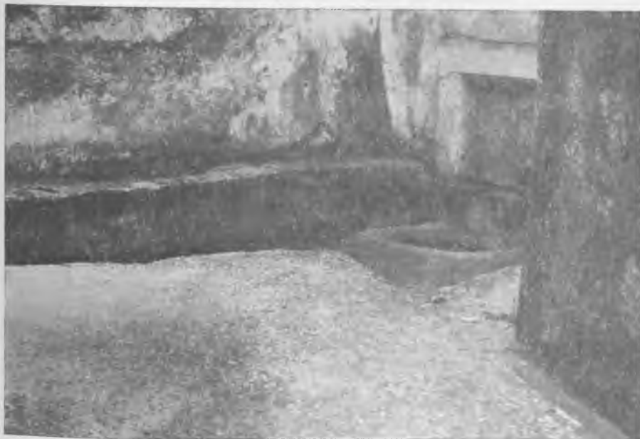
VISTA INTERIOR DE LA FONT "D'EN FERRIOL"

Es disputarà l'excel·lent Trofeu donat per Transports SEL·LÉS.