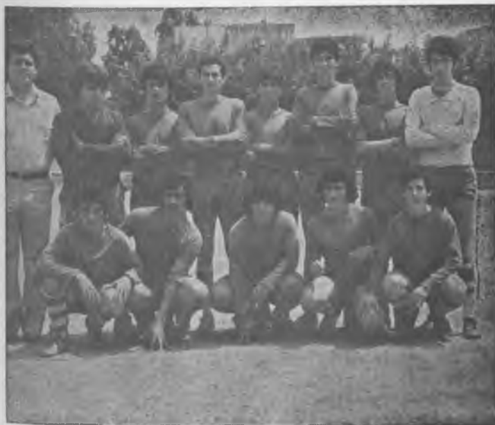
EQUIP DE JOVENIVOLS