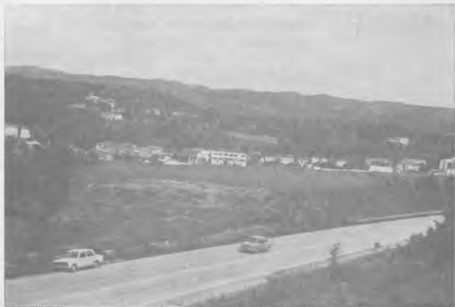
Vista de Quart des de l'accés a l'autopista