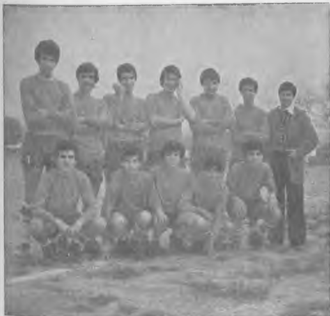
EQUIP DE CADETS