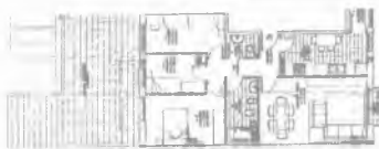
PLANTA PRIMER PIS

3 habitacions Menjador-estar Bany complert Cuina-office amb safareig Lavabo Terrassa 34m 2