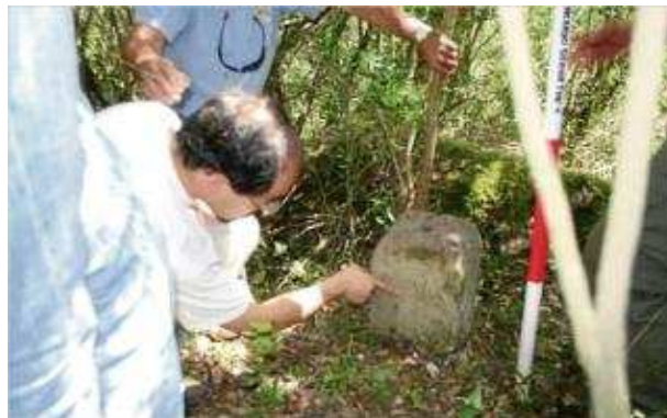
Moment en què els tècnics marquen la fita i tracen les coordenades GPS a Tossa de Mar aquest any.

A partir d'ara el Departament de Governació té dos mesos per resoldre la delimitació i llavors publicar-ho